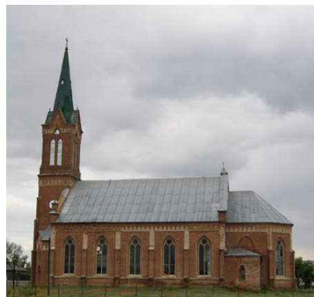
Лютеранская церковь конца XIX века