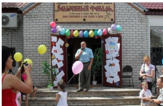
Городской театральный центр досуга «Волшебный фонарь»