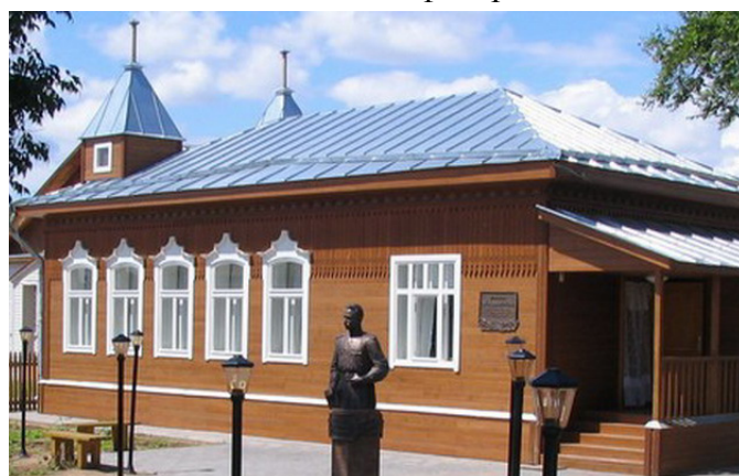
Краеведческий музей «Земля-Космос»