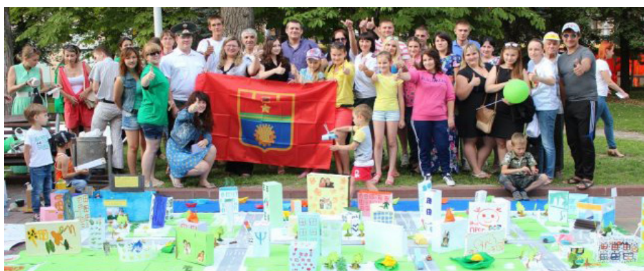
Профилактическая молодёжная акция «Город, который будет!»