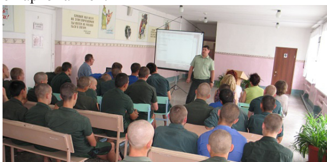
Акция под названием «Мы выбираем жизнь!» для воспитанников Камышинской колонии

В целях привлечения внимания граждан к проблемам наркомании и наркопреступности, а также формирования у подростков и молодежи антинаркотического мировоззрения, привычки к здоровому образу жизни и занятиям спортом в городе Волгограде и Волгоградской области были проведены ряд антинаркотических мероприятий, приуроченных к Международному дню борьбы с наркоманией.