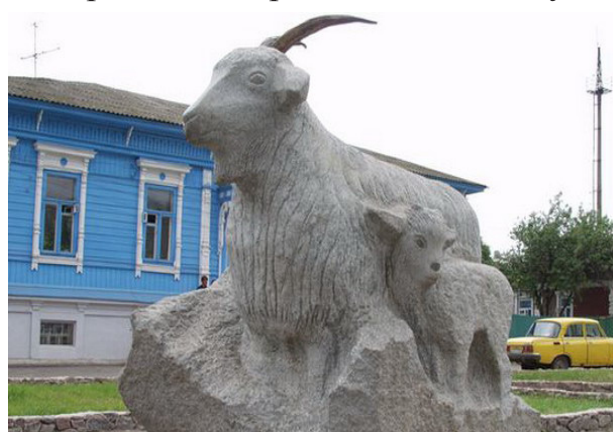
Памятник Козе, скульптурная композиция «Рукодельницы» и Музей козы

будет дан старт долгосрочному библиотечному проекту «Семь чудес культуры Волгоградской области», в рамках которого с апреля по ноябрь 2014 года в семи районах региона, ставшими победителями голосования, пройдут литературно-краеведческие праздники с приездом мобильного библиотечно-информационного центра «Волгоградский библиобус».