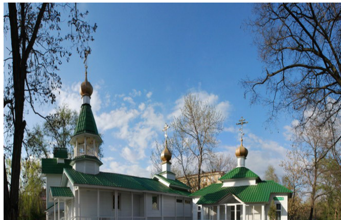
Святой источник и икона Божьей Матери