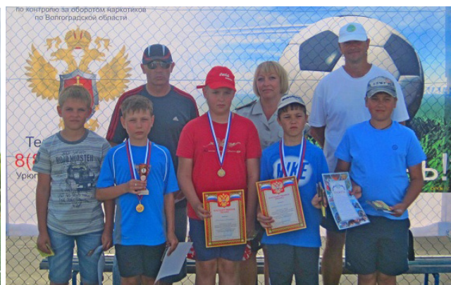
Турнир по большому теннису среди девочек и мальчиков в возрастной категории 12 лет и младше

http://34.fskn.gov.ru телефон доверия 39-41-00 email: vgnarkopol@mail.ru