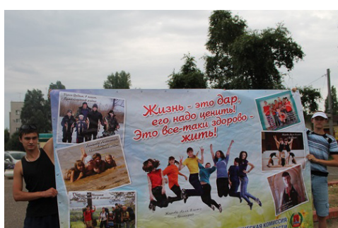
Фестиваль «Включись в движение улиц»