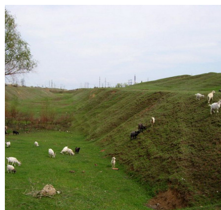
Соединительный канал рек Волга-Иловля