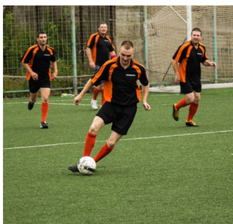
Товарищеский футбольный матч, посвященный Международному дню борьбы с наркоманией