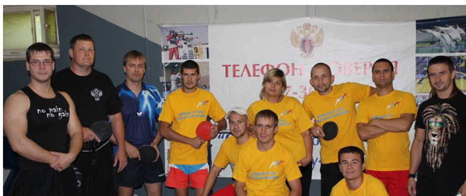
Товарищеский турнир по настольному теннису