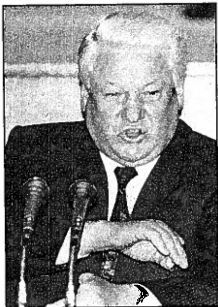
Без окончания чеченской войны и удаления национал-социалистов из Кремля Ельцину выборы не выиграть

Собственно, проблема общая для всех постсоциалистических эконо-