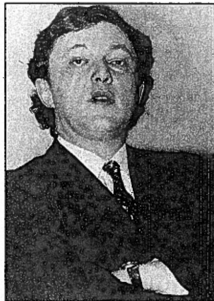
Зюганова можно поддержать, только если он ясно выскажет свое отношение к программе коммунистов

Огромный ядерный потенциал может в первый раз в истории попасть в руки неустойчивого, слабого, не уверенного в себе и потому особенно опасного национал-социалистического режима. К сожалению, гарантии, что он им распорядится мало-мальски ответственно, не может дать никто. Эти соображения подводят к жесткому выводу: ответ-