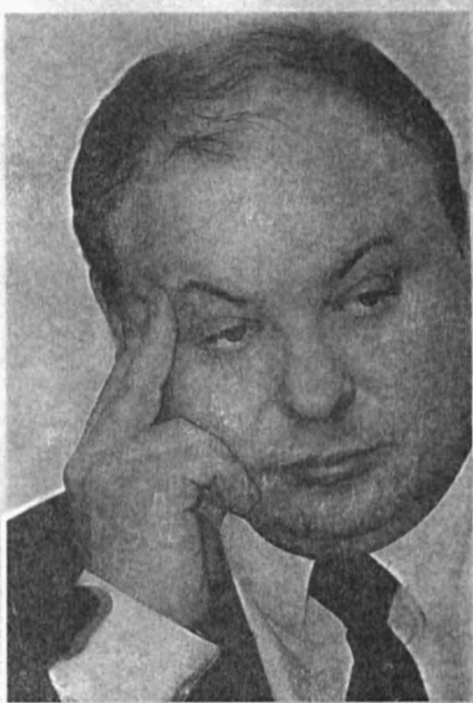
«Россия XXI века могла бы сыграть ту самую роль, какую в XIX–XX веках играли Соединенные Штаты»

Это не удовлетворит потребностей России в дополнительной рабочей силе на длительный срок. Со временем при-