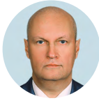
А.А. Каульбарс Аудитор Счетной палаты Российской Федерации