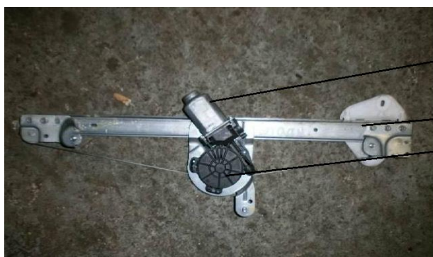
Электрический мотор, механизм стеклоподъемника, редуктор

Необходимо отметить, что основным компонентом данной товарной позиции является электродвигатель, характеристики которого положены в основу классификации (классификационным признаком является номинальная мощность электродвигателя мотор-редуктора стеклоподъемника) 11 . При этом при номинальной мощности двигателя не более 37,5 Вт товар классифицируется кодом 8501109900 ТН ВЭД ТС, ставка пошлины - 15 %, при мощности не более 750 Вт - код 8501310000 ТН ВЭД ТС, ставка пошлины - 0 процентов.