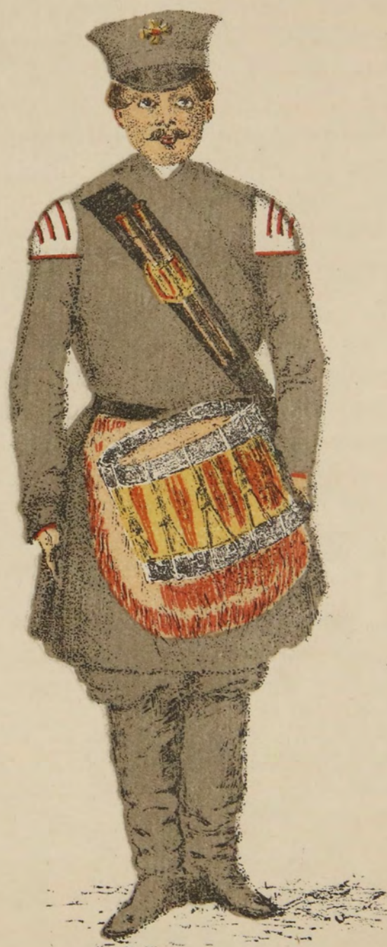
Барабанщикъ и горнистъ.