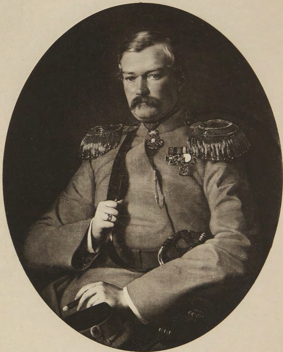
Фото-гравюра Шереръ Наболицъ и К о въ Москвѣ.