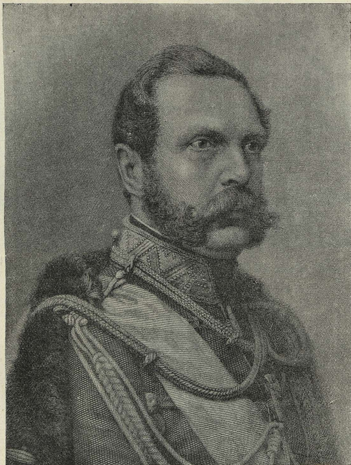
ИМПЕРАТОРЪ АЛЕКСАНДРЪ II