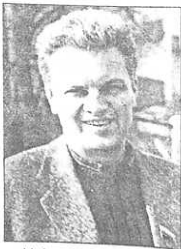
Արկադի Յանկովսկի ՈՂ ՊԴ պատգամավոր, «Ռուսաստանի տարածաշրջաններ» խմբակցության անդամ