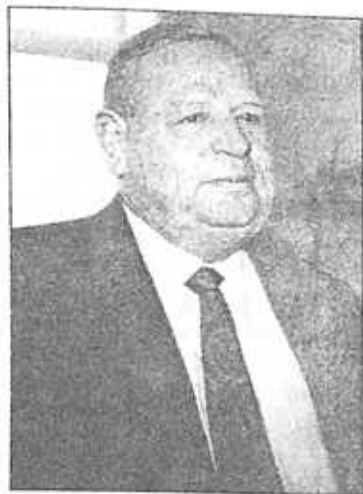
Անրի Սարգի Եվրախորհրդարանի պատվավոր անդամ