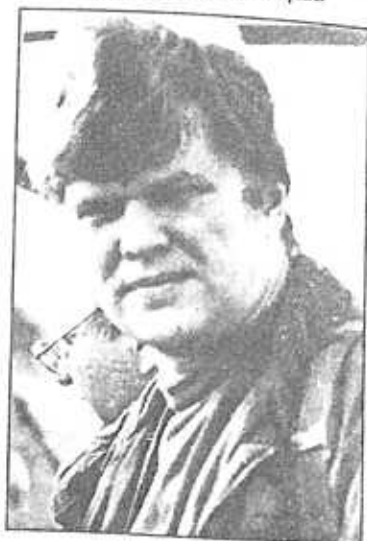
Անկայս ճամուլի ներկայացուցիչ (Ռուսաստան)