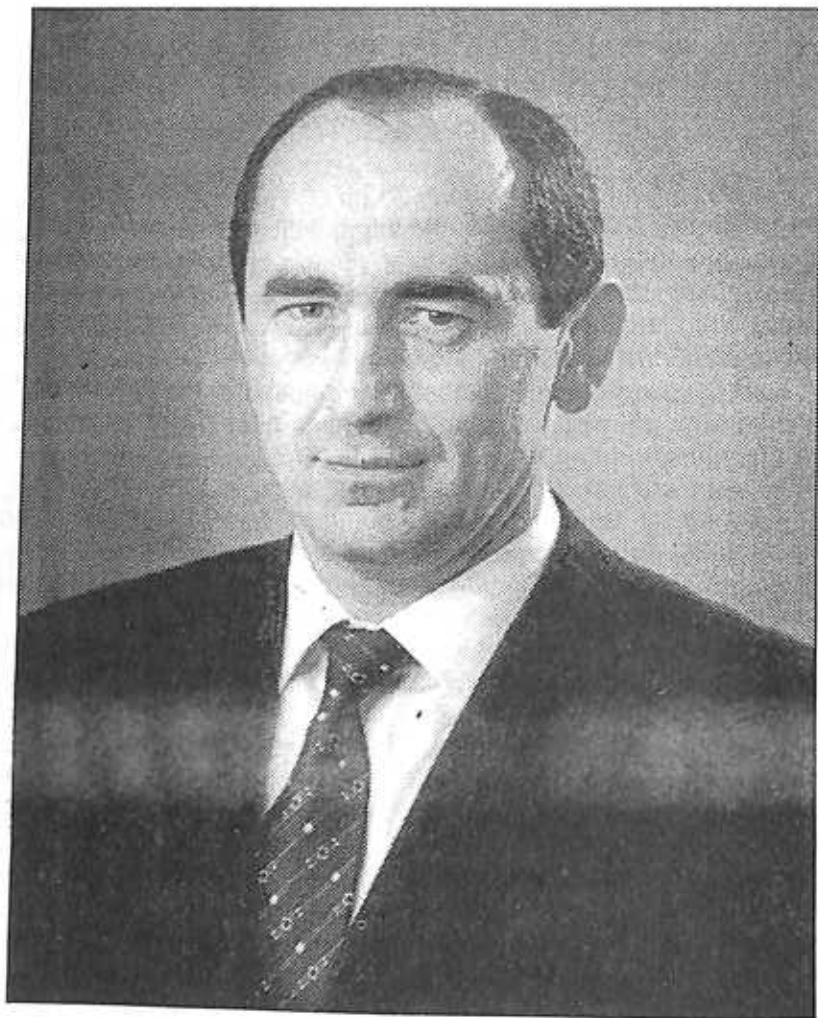
Ռոբերտ Սեդրակի ՔՈՉԱՐՅԱՆ

Լեռնային Ղարաբաղի Հանրապետության առաջին նախագահ