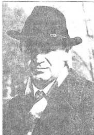
Պավել Բուրդուկով ՈՂ Պետդունայի պատգամավոր