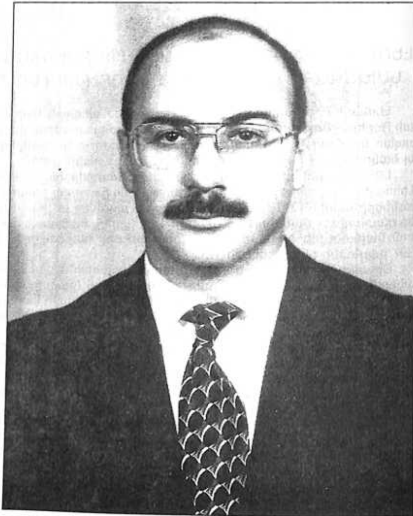
Արկադի Արշավիրի ՂՈՒԿԱՍՅԱՆ Լեռնային Ղարաբաղի Հանրապետության Նախագահ

Արրուր Բաբկենի Թովմասյանին 1962 թվականի ծնված, Ստեփանակերտ քաղաքի բնակիչ, ԼՂՀ Ազգային ժողովի նախագահ, անկուսակցական