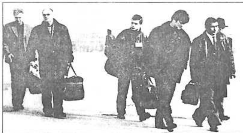
ԼՂՀ նախագահի ընտրության նախօրյակին Ստեփանակերտ են ժամանել միջազգային կազմակերպությունների տասնյակ դիտորդներ եւ լրագրողներ:

Հանրապետության 89.733 ընտրողներից ընտրությանը մասնակցել են 70.052 հոգի կամ ընտրողների ընդհանուր թվի 78,07 %-ը: