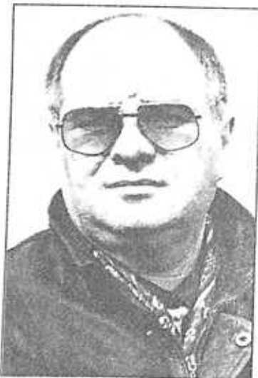
Սերգեյ Միտրոխին ՈՂ Պետդունայի պատգամավոր