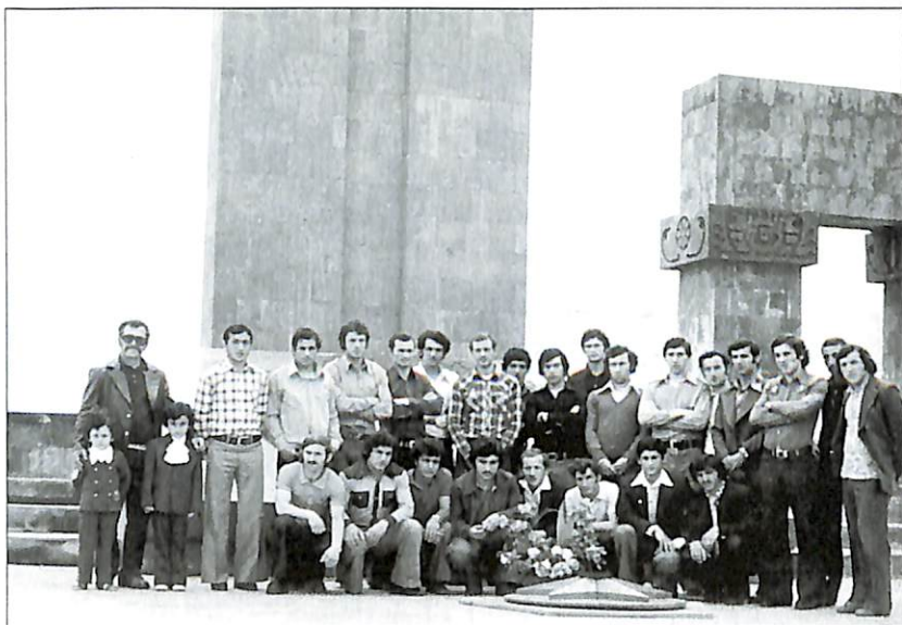
Երևանի «Արարատ» և «Ղարաբաղ» ֆուտբոլային թիմերը Ստեփանակերտում