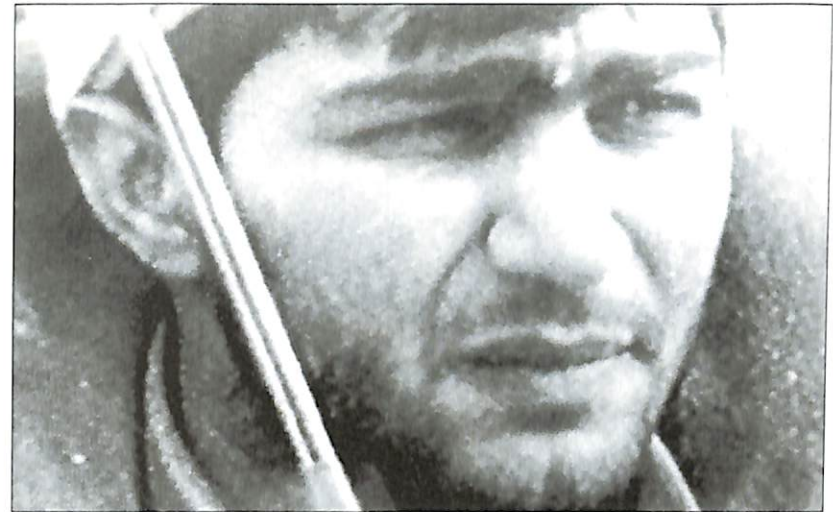
Կենտրոնական պաշտպանական շրջանի հետախուզության պետ Անդրանիկ Սարգսյանը

Աբովյանից Սամվելի ջոկատն ուժեղացված ձեւով ուղարկե-ցին Ղարաթաղու գյուղը՝ հանցագործներին լաւատելու եւ գողաց-