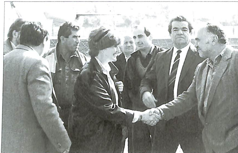
Հանդիպում Քերոլայն Քոքսի հետ