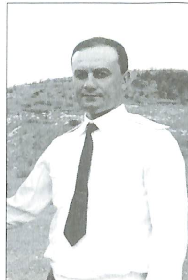
Լ.Լ. պաշտպանության նարարար Սեյրան Օհանյան