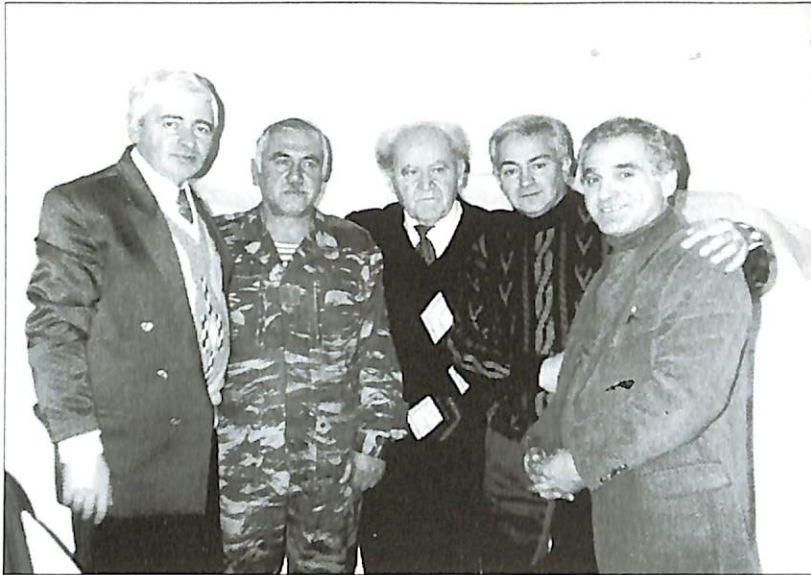
«Ամարաս» տպարանում, Երևան, 1998թ.