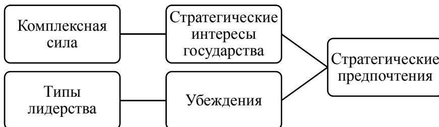
Рис. 1-2. Взаимосвязь между стратегическими интересами государства, убеждениями его лидеров и предпочтениями при стратегическом выборе

Чтобы углубить наше понимание логических взаимосвязей, представленных на рис. 1-2 нам необходимо выделить разновидности государств на основе критериев их комплексной силы и лидерских качеств. На этой основе мы сможем научиться определять, в зависимости от уровня комплексной силы государства, его важнейшие стратегические интересы, а также, в зависимости от типов политических лидеров, к каким убеждениям они будут склонны.