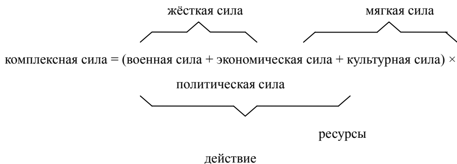
Рис. 1-1. Взаимосвязи между различными факторами силы

Введём следующие обозначения: КС – комплексная сила; В – военная сила; Э –