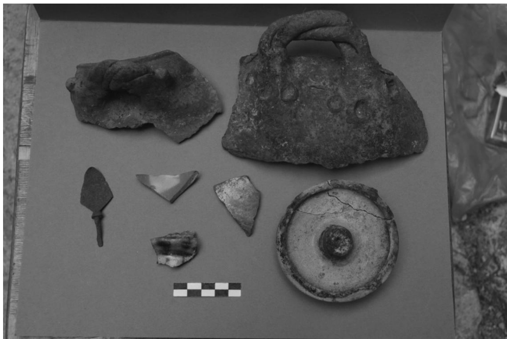
Իրեր՝ գտնված Կարկառ ամրոցի հարթակի պեղումներից, 12-14 թդ դարեր