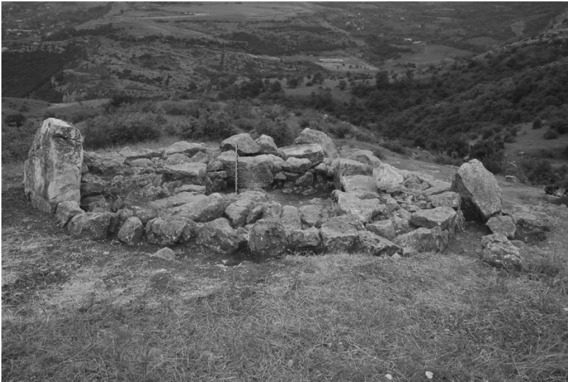
Դամբարան թիվ 61, մ.թ.ա. 7-6-րդ դդ. ընդհանուր տեսքը