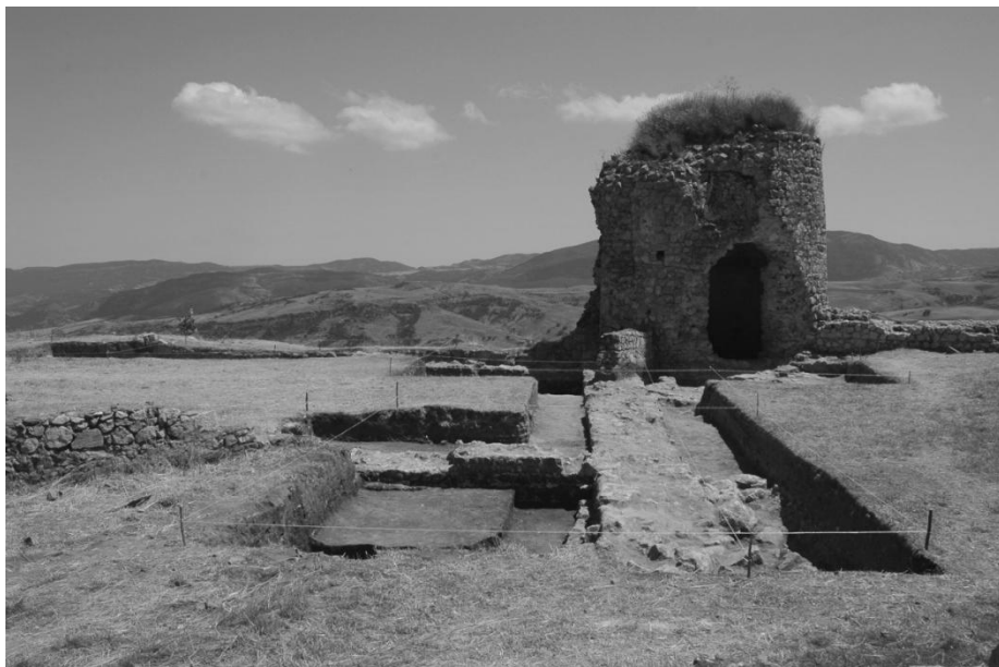
Շոշվա սղնախը. պեղված հատվածի ընդհանուր տեսքը