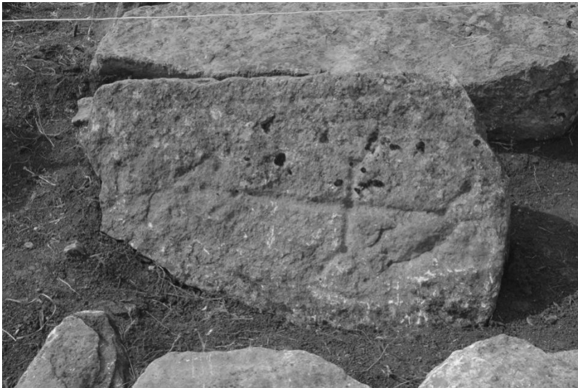
Հայ-ռուսական գերեզմանոցի 12-13-րդ դդ. խաչքարերից