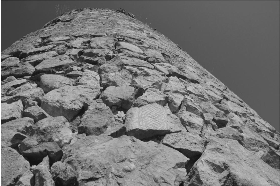
13-րդ դարի խաչքարի բեկոր Շոշվա սղնախի աշտարակի շարվածքում