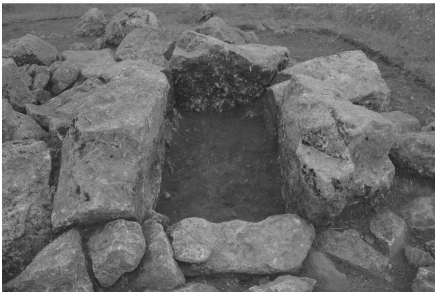
Դամբարան թիվ 175/1 պեղումներից հետո