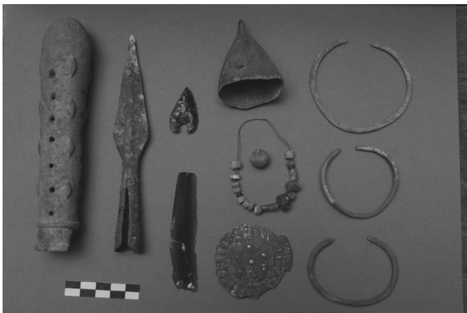
Իրեր թիվ 61 և 175/1 դամբարաններից