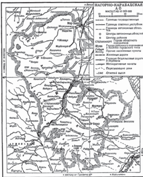
ՆԿԱՐ 2 3

Այսպիսով, մոտ երկու տասնամյակ շարունակ ԼՂԻՄ-ի տարածքային յուրացմանն ու թուրքացմանն ուղղված Ադրբեջանի հետևողական քաղաքականության արդյունքում, որն ի դեպ շարունակվեց նաև հետագայում, տարբեր պատրվակներով մարզի սահմաններից պարբերաբար պոկվում և նրա ենթակայությունից դուրս էին բերվում գյուղեր ու հողատարածքներ և միացվում էին հարևան շրջաններին: Այդ բոլոր բնակավայրերը, առանց բացառության, ժամանակի ընթացքում հայաթափվում էին, բնակեցվում ադրբեջանցիներով և ամբողջապես թուրքացվում: Արդեն 1930-ականների վերջին մարզը սեղմվել և վերածվել էր բոլոր կողմերից ծվատված, մոտ 4.5 կմ 2