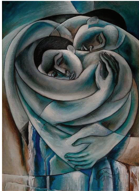
Նկ. 15. Սիրո կերոն, 2005 կտ., յուղ., 72×100