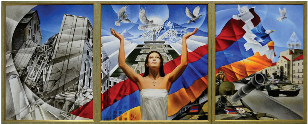
Նկ. 17. Եռանկար «Ցեղասպանությունից անկախություն», 2014 կտ., յուղ.

մաս 1. Տեսիլ ոչ չարիք, լսիլ ոչ չարիք, 100x130 մաս 2. Ակն ընդ ակն, ատամն ընդ ատամ, 120x130 մաս 3. Թղթյա աղավնին, 100x130