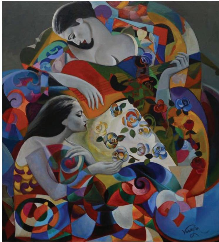
Նկ. 14. Կապույտ վարդերի մեղեդին, 2005 կտ., յուղ., 108×121