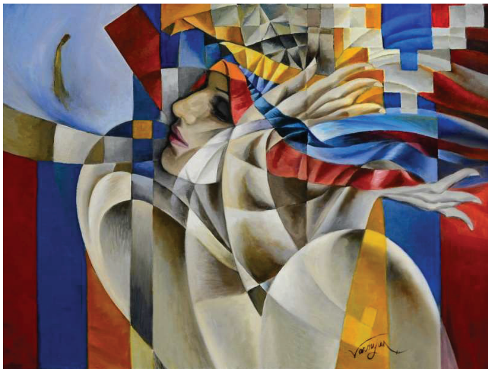
Նկ. 12. Մեկ հայրենիք, երկու հանրապետություն, 2014 կտ., յուղ., 76×100