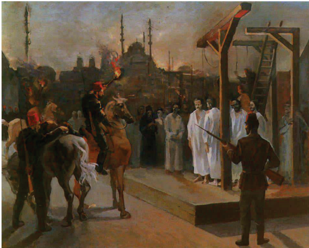
Նկ. 2. «20 կախադաններ»

Հայոց ցեղասպանությանը նվիրված վահանակներ ԱՄՆ-ում