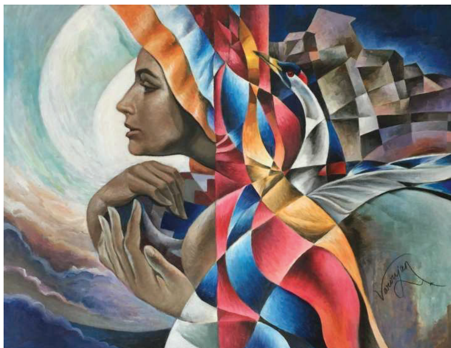
Նկ. 13. Հայաստան-Սփյուռք-Արցախ, 2014 կտ., յուղ., 76×100