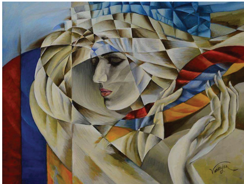
Նկ. 11. Անկախության քամին, 2014 կտ., յուղ., 76×100