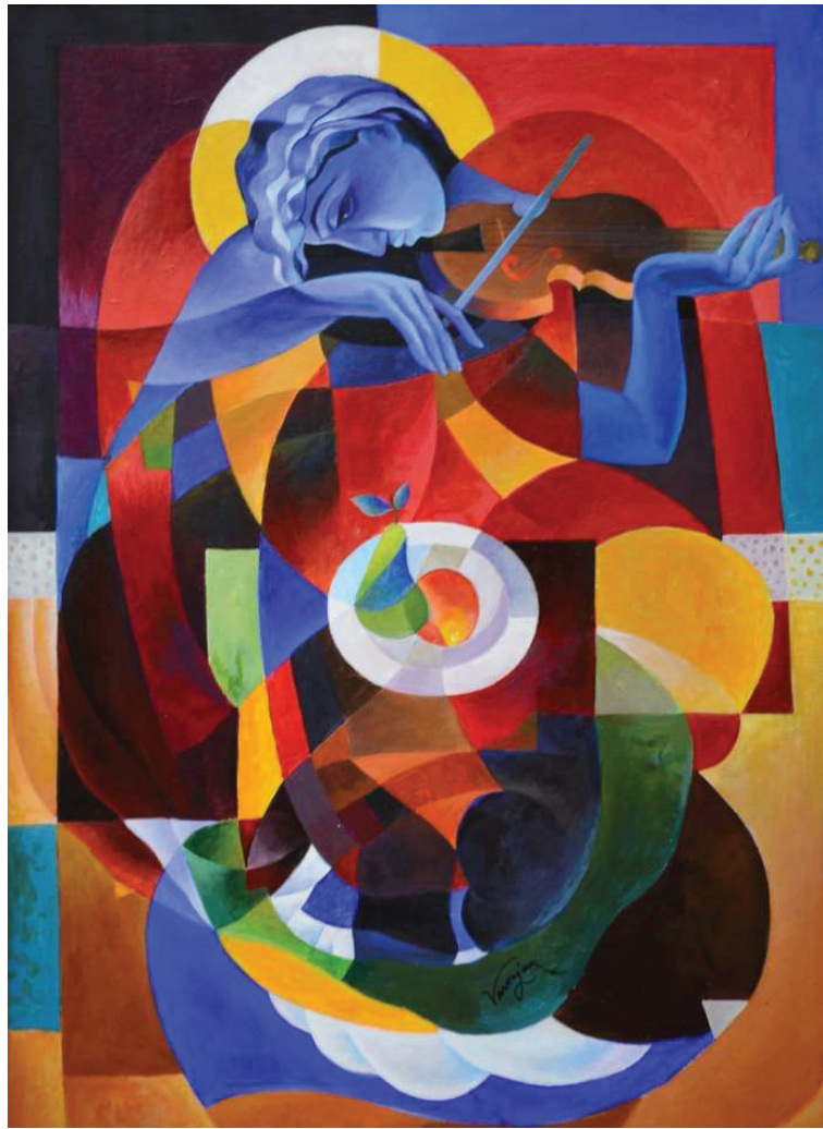
Նկ. 10. Խաղաղության հրեշտակը, 2014 կտ., յուղ., 72×100