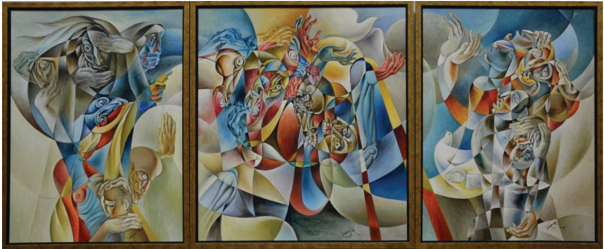
Նկ. 16. Եռանկար «Ղարի ոճիրը», 2014 կտ., յուղ.

մաս 1. Տեսիլ ոչ չարիք, լսիլ ոչ չարիք, 100x130 մաս 2. Ակն ընդ ակն, ատամն ընդ ատամ, 120x130 մաս 3. Թղթյա աղավնին, 100x130