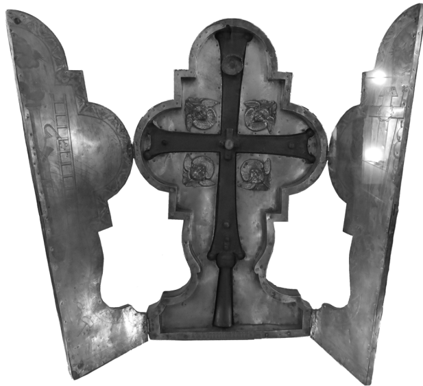
Աշոտ Երկաթի երկաթյա խաչը

Այսպիսով, Մայր տաճարի թանգարանի երկու խաչերի շուրջ մեր անդրադարձը երևան է հանում այն իրողությունը, որ դրանց պատրաստման նյութերը՝ երկաթն ու բյուրեղը, պատահաբար չեն ընտրված ու խորհրդանշում են Աշոտ Երկաթի ու Աշոտ Ողորմածի մականունները: