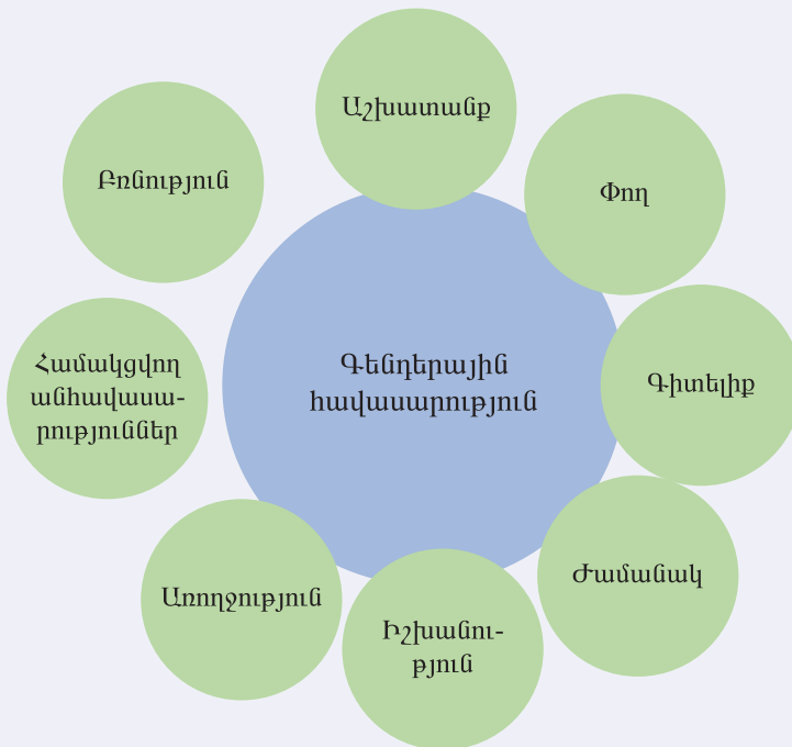
Նկ. 1. Գենդերային հավասարության ինդեքսի բաղադրիչները 11

Գենդերային հավասարության եվրոպական ինստիտուտի կողմից մշակված գենդերային հավասարության ինդեքսում (ԳՀԻ) առանձնացված են գենդերային հավասարության/անհավասարության դրսևորման հետևյալ հիմնական բնագավառները՝ աշխատանք, փող, գիտելիք, ժամանակ, իշխանություն, առողջություն: Իսկ բռնությունը համարվում է գենդերային հավասարության արբանյակային բնագավառ: Արբանյակային բնագավառ է համարվում նաև «համակցված անհավասարությունը», որը ցույց է տալիս սեռի և այլ գույակցվող գործոնների (օրինակ, ազգություն, տարիք, ռասա, կրոն և այլն) համակցված ազդեցությունը գենդերային հավասարության վրա: