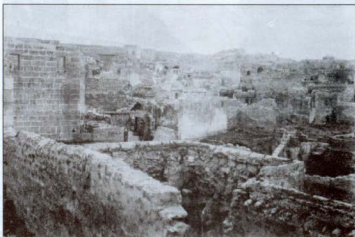
Նկար 7. 1915 թ. աշնանը թուրքական զինված ուժերի կողմից քարուքանդ արված՝ Ռոֆայի Հայկական թաղամասը, որը հետագա տարիներին նաև ամբողջովին թալանվել է: