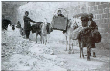
Նկար 4. Հիվանդանոցի տեղափոխում Ռոբա՝ միսիոներական հիվանդանոց (1912 թ.): Հիվանդանոցը բուժվելու էին գալիս՝ կտրելով մինչև ութ օրվա ճանապարհ: