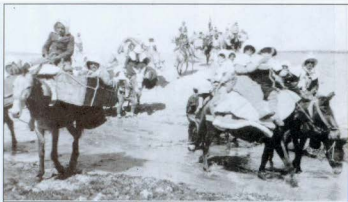
Նկար 9. 1922-ին «Մերձարևելյան նպաստամատույց» (Near East Relief) կազմակերպության Քանձնարարությանը Յակոբ Քյունցլերը կազմակերպեց մոտ 8000 որբացած քրիստոնյա երեխաների տեղափոխումը Սիրիա՝ արևելյան և կենտրոնական Թուրքիայից, որտեղ ազգայնական աշխարհագործ անցկացրել էր «էթնիկ մաքրագործումներ»: Նկարում՝ երեխաների ջորիներով տեղափոխումը գետակի վրայով: