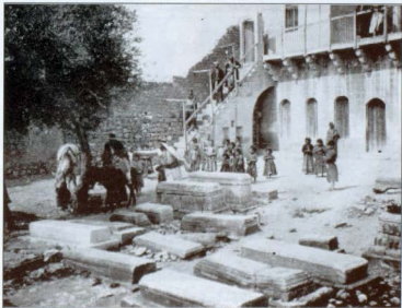
Նկար 5. Միսիոներ բժիշկ Անդրեաս Ֆիշերի՝ հիվանդանոցի ընդունելության օրվա մի պահ Քայկական Գարմուջ գյուղի նկեղեցում (1909 թ.):