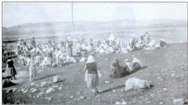
Նկար 11. Ուրֆայի որբանոցի 130 տղաների ու աղջիկների մի խումբ՝ դեպի Հայեպ արտագաղթելիս: Երկու օրվա ճանապարհ անցնելուց հետո կեսօրվա դադար ջուր եղած մի վայրում: