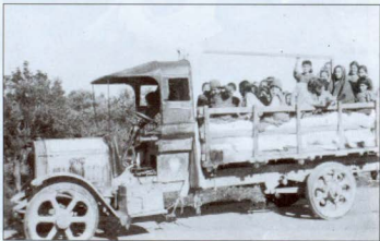
Նկար 10. Բեռնատար մեքենաներով կույրերի և անդամալույծների տեղափոխումը (1922 թ.):