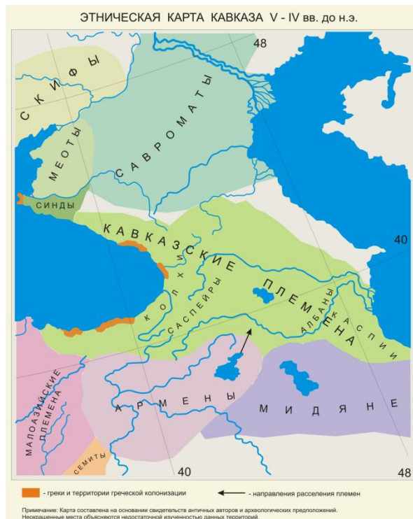
Պատմական փաստերի ներգալիտման օրինակ