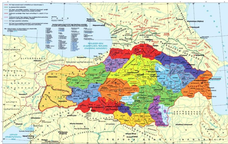
Հայերը ըստ «Աշխարհացոյց»-ի