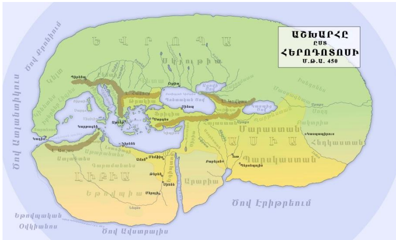
Աշխարհը ըստ Հերոդոտեսի (մ.թ.ա. 450)