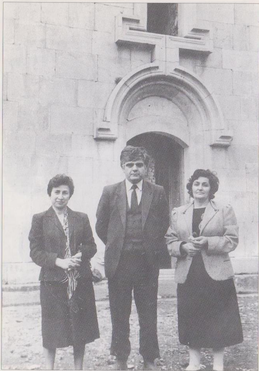
«Սովետական Հայաստան» թերթի աշխատակիցների հետ Ամարասում

նատարությամբ: Ադրբեջանի կոմկուսի Կենտկոմի քարտուղար Ասադովը լուր է տարածում, թե հարևան շրջաններից 100 հազար ադրբեջանցիներ պատրաստ են ներխուժել Լեռնային Ղարաբաղ և կազմակերպել նոր 1920 թվական: Ադրբեջանական շրջաններից Ստեփանակերտ և մարզի շրջկենտրոններ են բերվում միլիցիայի ջոկատներ, շուրջ 2 հազար հոգի: Այդ օրերին մարզի կուսակցական և պետական մարմինների որոշ ղեկավարներ հյու-հնազանդ ծառայում էին Ադրբեջանի դրածո Բ. Ս. Կևորկովին, գտնվում էին մոլորության մեջ և չէին համարձակվում անցնել ժողովրդի կողմը: