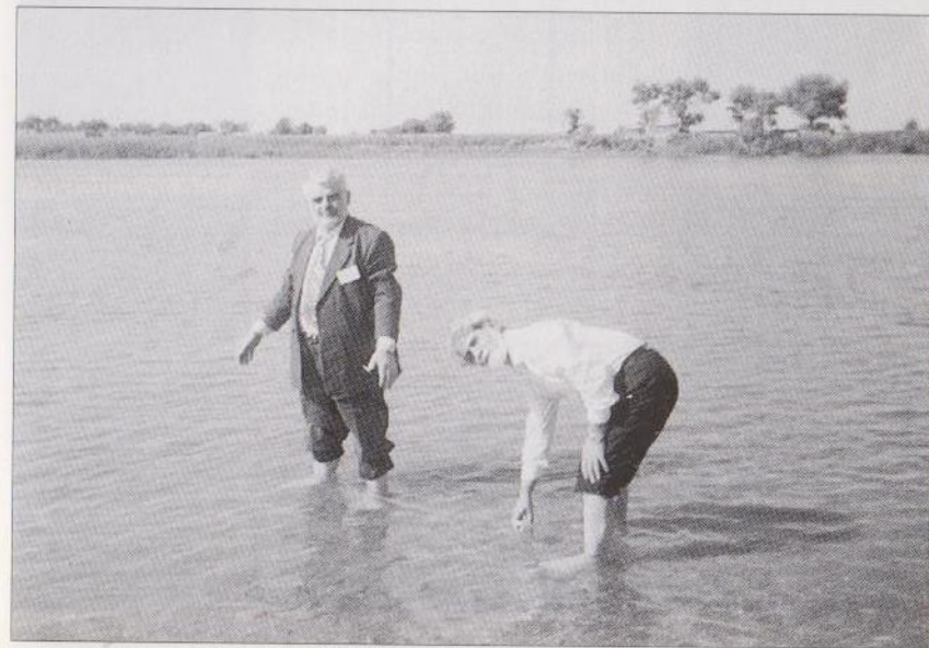
Գեր-Չոր, 24 ապրիլի, 2001