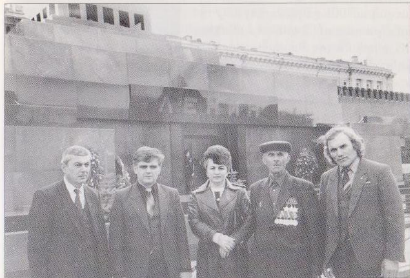
1988թ. մայիսին Մոսկվա մեկնած պատվիրակները