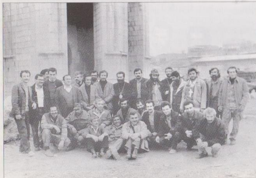
9 մայիսի, 1992: Ազատագրված Շուշիում