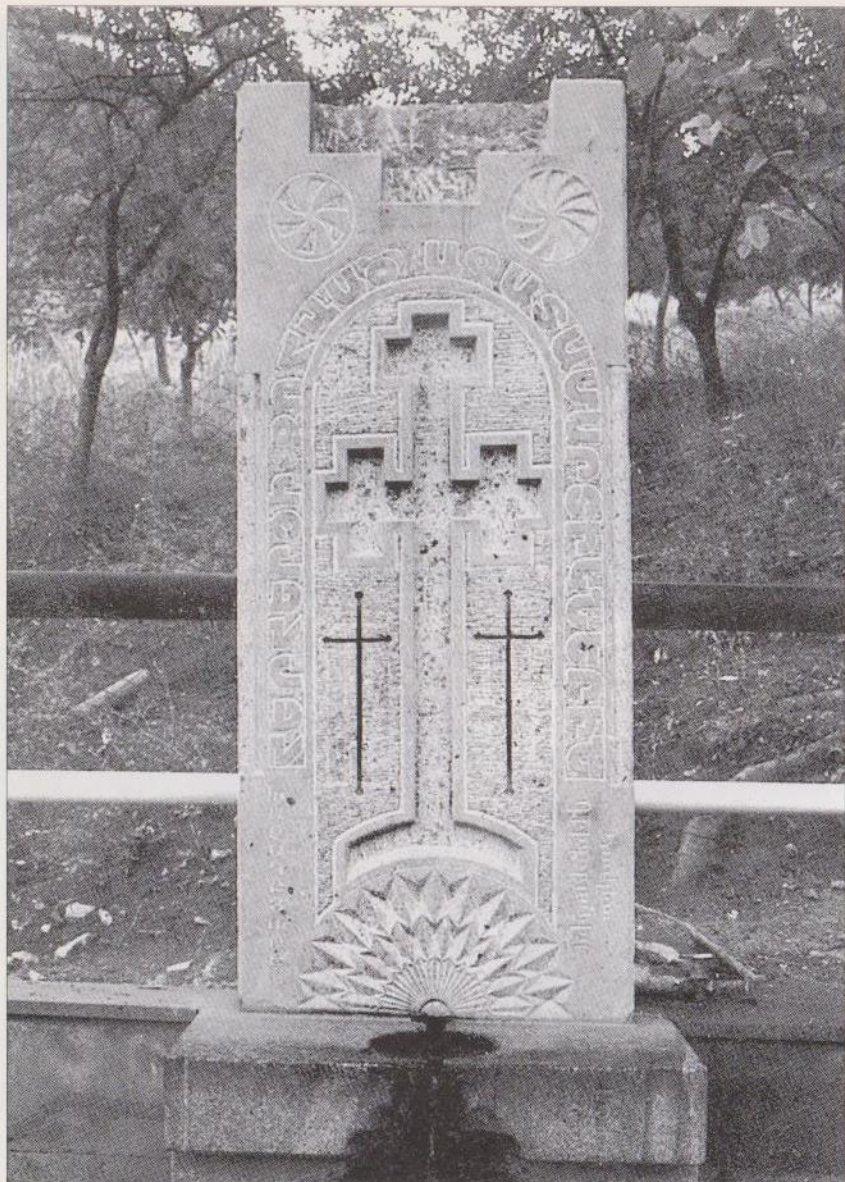
Հերերից գոհված ազատամարտիկների պատվին կառուցված հուշարձան-աղբյուրը