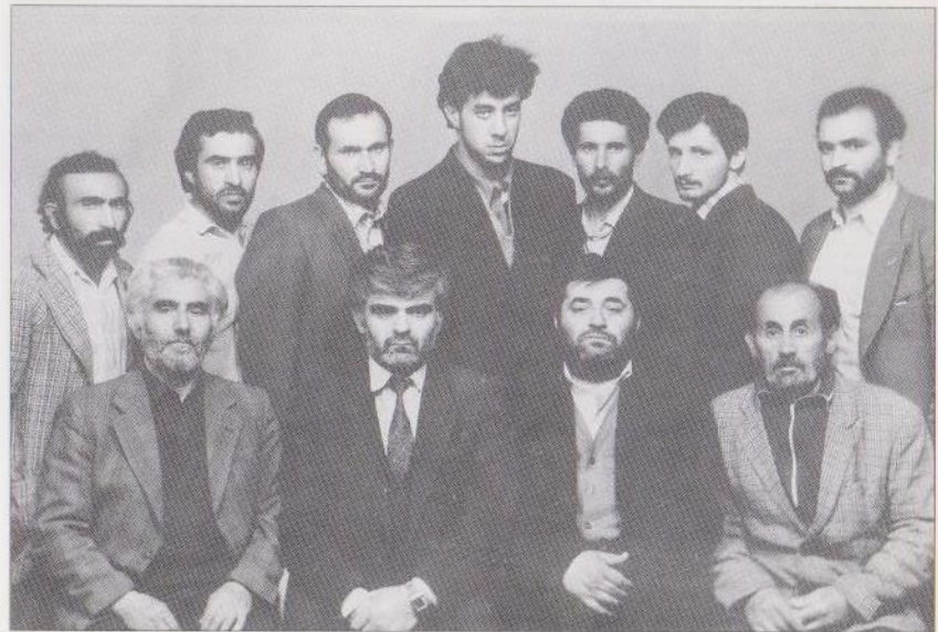
1990թ. մայիսին Պյատիգորսկի բանտի պատված մի խումբ արցախցիներ