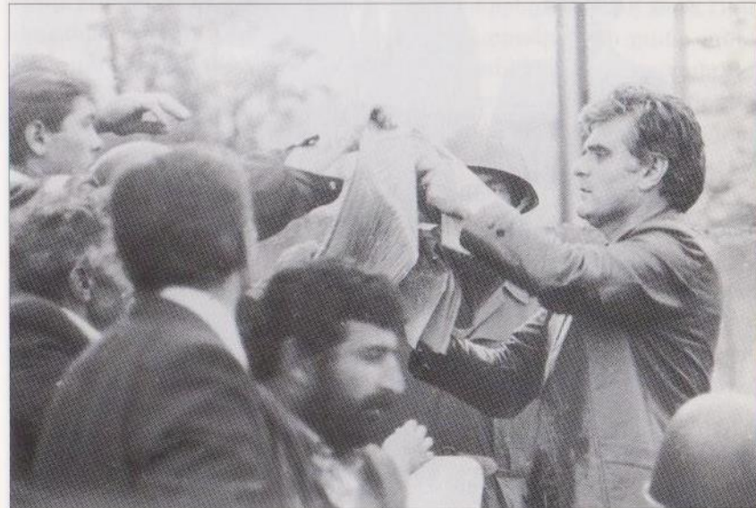
Համետը բաժանում է «Սովետական Ղարաբաղ» քերթի 1988թ. հունիսի 23-ի համարը