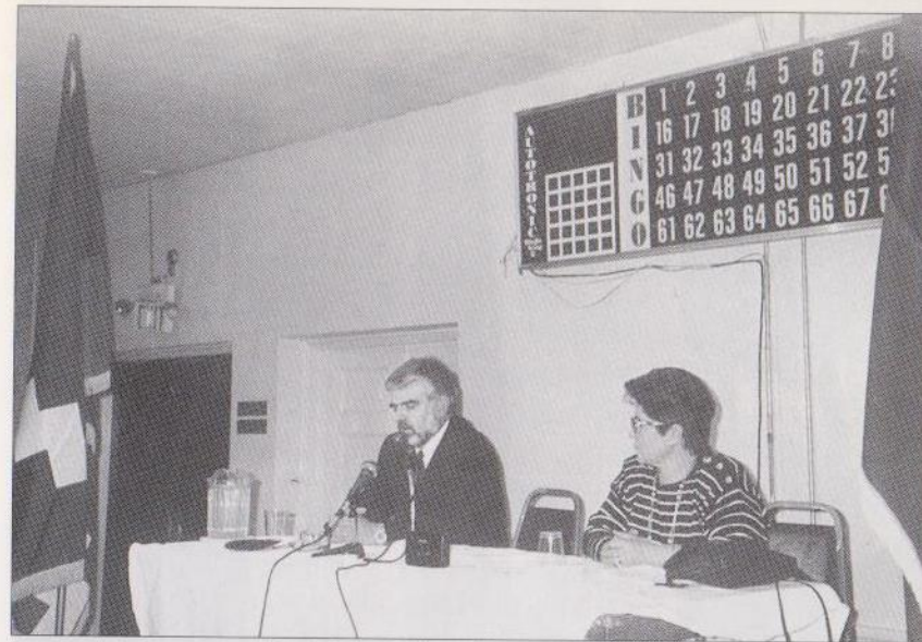
Համետը ԱՄՆ-ում ելույթ է ունենում