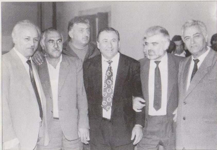
Արցախի ՀՀ Գերագույն խորհրդի պատգամավորների մի խումբ