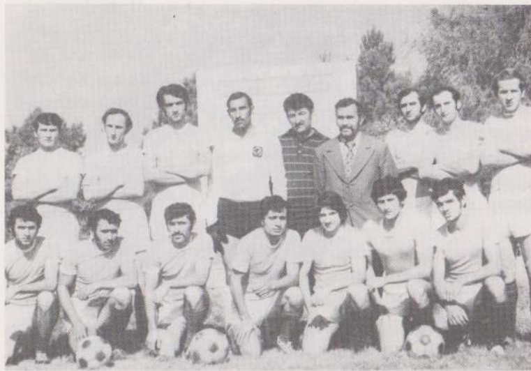
Ադրբեջանի չեմպիոն «Կարաբաղ» թիմը (1977 թ.)