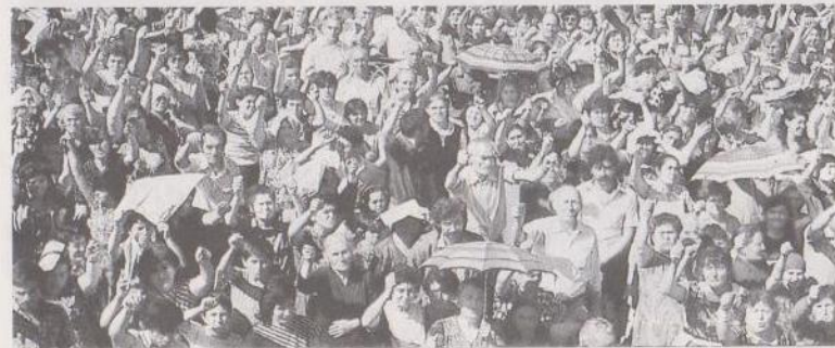
Միտինգ Ստեփանակերտում