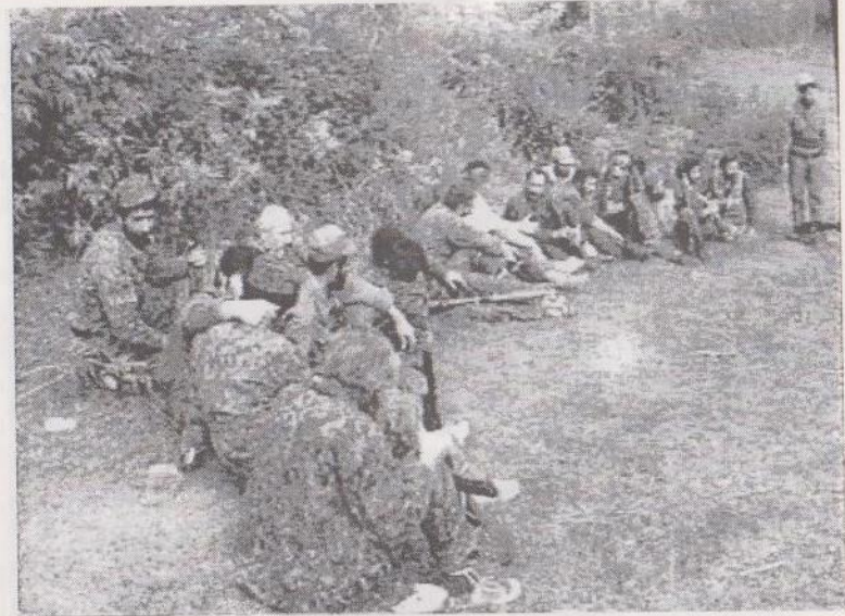
Ջոկատս հանգստի պահին