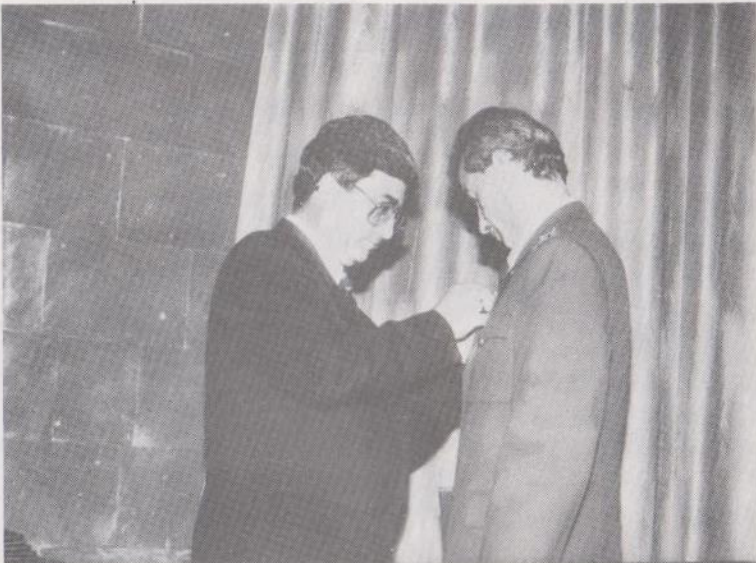
Նախարար Սերժ Սարգսյանը Մարտական խաչի շքանշան է ամրացնում Արթուր Ալեքսանյանի կրծքին

որտեղից հաղորդումները փոխանցվում էին Նախիջևան: Այնտեղ թուրք պահապաններ կային, որոնք մեզ նկատեցին: Յոթ-ութ հոգի էին, ձիավորներ: