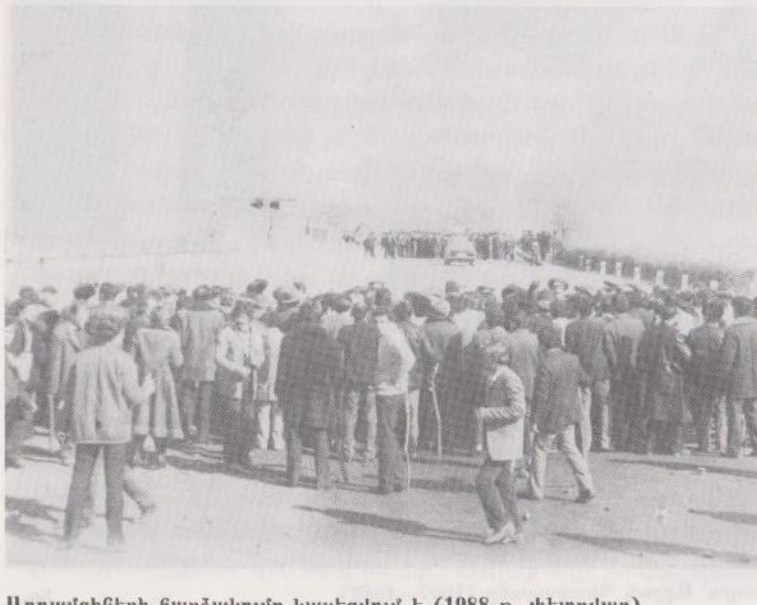
Ադղամցիների հարձակումը կասեցվում է (1988 թ. փետրվար)

լիովին կտրելու նպատակով: Մարզը խիստ կարիք ուներ նաև ավտոբուսներին: