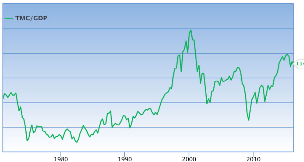
Գծանկար 1. Շուկայի կապիտալացման գործակից/ՀՆԱ հարաբերակցություն

հայտ գալու մեծ հավանականության մասին: Այսպես, 2000թ-ին, Համաշխարհային բանկի տվյալների համաձայն, գործակիցը հաշվարկվել էր 153%, որը գերարժևորման նշան էր: Հենց այդ ժամանակ տեղի ունեցավ ինտերնետային (dotcom) «փուչիկի» պայթյունը, իսկ, օրինակ 2007թ-ին՝ մեծ ֆինանսատնտեսական ճգնաժամի նախօրեին, այն կազմում էր գրեթե այնքան, որքան այսօր է: Գրաֆիկորեն այն կունենա հետևյալ տեսքը 1 .