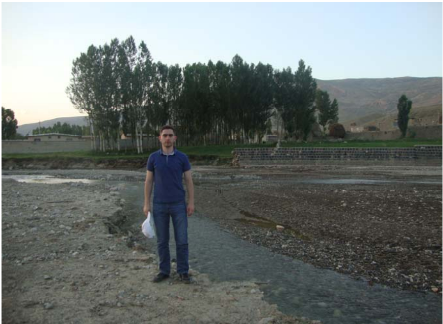
Ուխտատրների խումբը Ասարայրի դաշտում (Էմամդղլի-Բալայի գետանց)