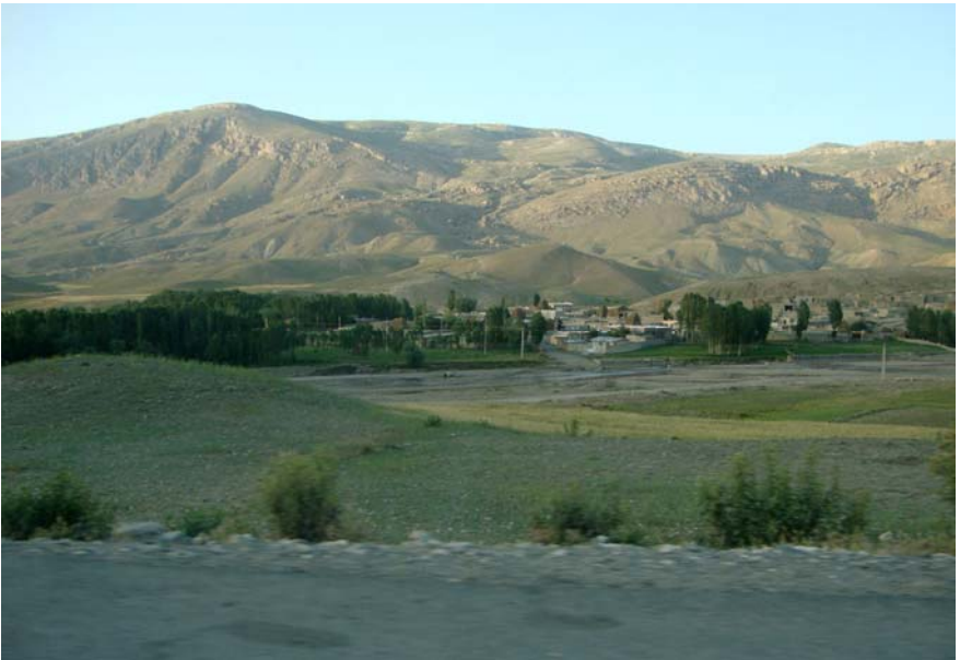
Աարայրի դաշտ (Էմամղոլի-Բալայի գետանցը)