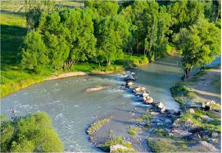
Աարայրի դաշտ (Աբարարաշիի գետանցը)