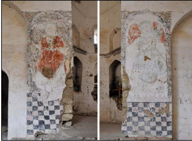
Նկ. 4. Ս. Հովհաննես Մկրտիչ եկեղեցու Միքայել հրեշտակապետի երկու որմնանկարները, 1793 թ.