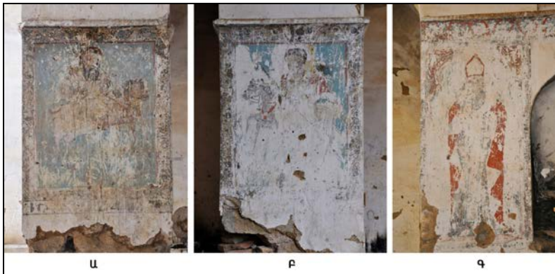
Նկ. 2. Ա. Հովհաննես Մկրտիչ եկեղեցու 1745 թ. որմնանկարները (Նկ.՝ հեղինակի, 2016 թ.). Ա - հյուսիսարևելյան մույթի հարավային երեսի սուրբ ձիավորի պատկերը, Բ - հարավարևելյան մույթի հյուսիսային երեսի սուրբ ձիավորի պատկերը, Գ - ավագ խորանի անհայտ սրբի պատկերը