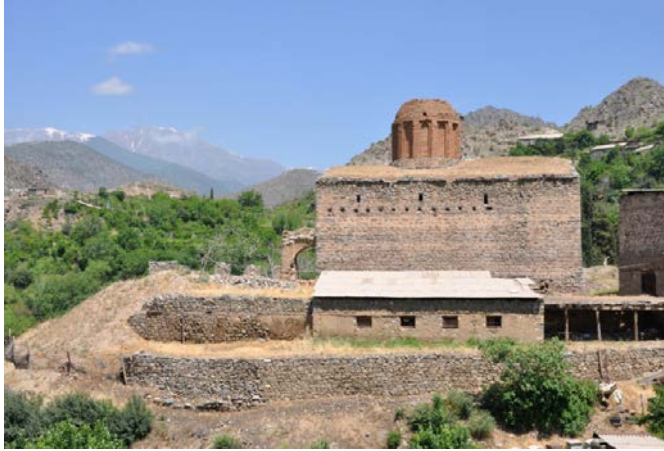
Նկ. 1. Մեղրիի Անապաստանաց վանքը հարավից (2017 թ.)