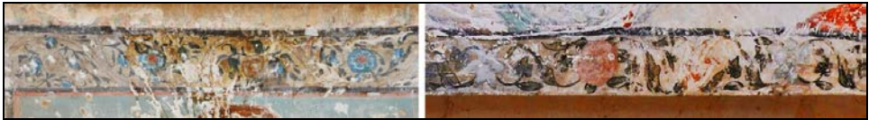
Նկ. 5. Ս. Հովհաննես Մկրտիչ եկեղեցու 1745 թ. (ծախից) և 1793 թ. (աջից) որմնանկարների զարդագոտիների նմուշներ (նկ.՝ հեղինակի, 2017 թ.)