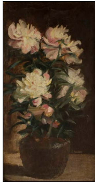
Նկ. 4. Քրիզանթեմներ (անթվակիր) կտավ, յուղաներկ, 47x27 սմ, ՀԱՊ