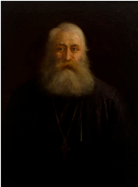
Նկ. 3. Մկրտիչ Ա (Իսրիմյան) կաթողիկոսի դիմանկարը (1900-1910 թթ.), կտավ, յուղաներկ, 102x77 սմ, ՀԱՊ