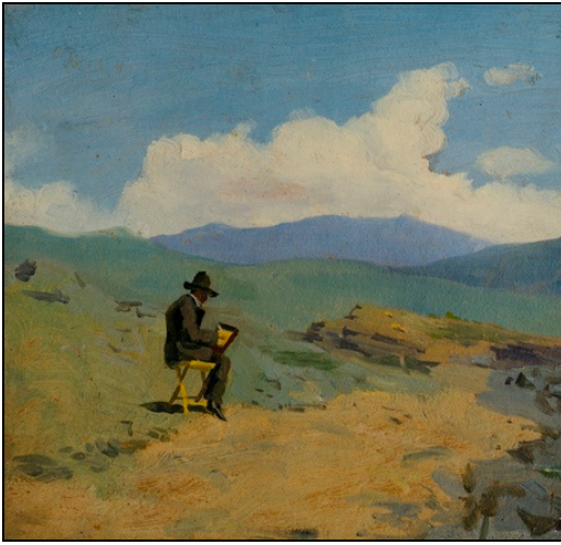
Նկ. 1. Նկարիչ Գարրիեյանը էսյուդի ժամանակ (1889 թ.), ստվարաթուղթ, յուղաներկ, 16x17 սմ, ՀԱՊ