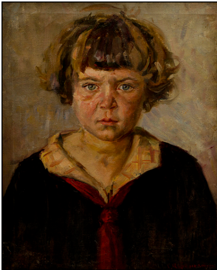
Նկ. 3. «Սերդան խճճված մազերով» 1928 թ., 48x40,5, կտ., յուղ., ՀԱՊ