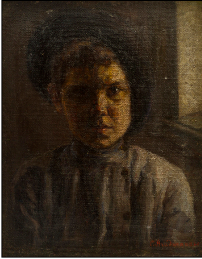
Նկ. 1. «Գլխարկով տղան» 1912-1913 թթ., 47x37, կտ., յուղ., ՀԱՊ