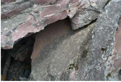
Նկար 5. Պաղաղբյուր. ժայռապատկերների կրկնօրինակում նորագույն շրջանում (Մ. Հերլես)

որն ակներևաբար տարբերվում է կետ-հարվածային եղանակից (նկ. 5): Ժայռապատկերների կրկնօրինակումը նորագույն շրջանում տարածված երևույթ է: Դրանք կարելի է տեսնել Հայաստանի այլ հնավայրերում ևս (նկ. 6):