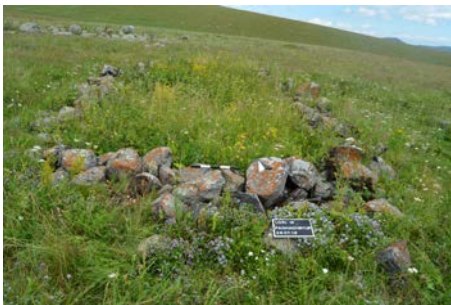
Նկար 7. Պաղաղբյուր. ուղղանկյունաձև շարվածք ժայռապատկերներից հյուսիս ընկած տարածքում (Մ. Հերլես)

Չնայած ժայռապատկերների թվագրության հարցը դեռ ուսումնասիրության սկզբնական փուլում է, սակայն, կարելի է նշել, որ Պաղաղբյուրի օրինակները իրենց՝ դարերի ընթացքում գոյացած աննշան փառով և տիպաբանությամբ կրկնում են Հայաստանից և հարակից տարածքներից հայտնի մյուս ժայռապատկերները: Սա թույլ է տալիս խոսել վերջիններիս նախապատմական բնույթի մասին: Պաղաղբյուրի ժայռապատկերներին կից գտնվող կառույցների և դամբարանների պեղումները կարող են նպաստել դրանց թվագրության խնդրի լուծմանը: