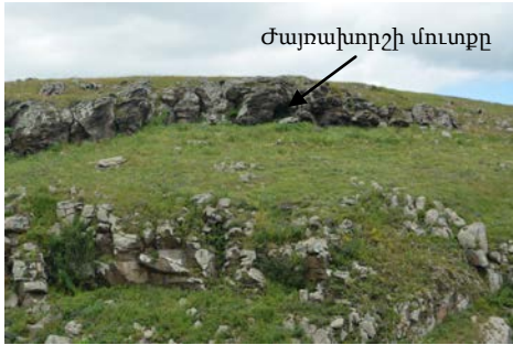
Նկար 1. Պաղաղբյուրի ժայռապատկերների քարափի ընդհանուր տեսքը (Մ. Հերլես)