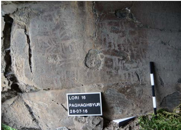
Նկար 3. Պաղաղբյուրի ժայռապատկերները (Մ. Հերլես)

Ժայռը մասնակիորեն վնասված է, այնպես որ դրա նախկին չափսի մասին կարելի է միայն ենթադրել: Ժայռապատկերներն արված են 1,20x 0,7 մ մակերեսի վրա, կազմված են բազմաթիվ մանր ակուններից, որոնք արված են, հավանաբար, քարե թակիչի զարկերով (նկ. 3):