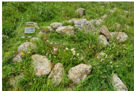
Նկար 8. Պաղաղբյուր. դամբարանի կրունկի ժայռապատկերներից հյուսիս ընկած տարածքում