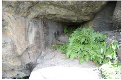
Նկար 2. Պաղաղբյուրի ժայռապատկերների ժայռախորշը (Մ. Հերլես)

Ժայռը մասնակիորեն վնասված է, այնպես որ դրա նախկին չափսի մասին կարելի է միայն ենթադրել: Ժայռապատկերներն արված են 1,20x 0,7 մ մակերեսի վրա, կազմված են բազմաթիվ մանր ակուններից, որոնք արված են, հավանաբար, քարե թակիչի զարկերով (նկ. 3):