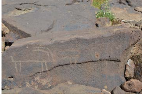
Նկար 6. Երկու հին (1-ին և 2-րդ) և մեկ նոր (3-րդ)՝ այժմ ժայռապատկերների օրինակներ Սեպասարից (Սյունիք) (Ֆ. Քնոլլ)

Քարափի հյուսիսային մասում՝ գետակի հակառակ ուղղությամբ հանդիպում են նաև բազալտ քարերից կազմված ուղղանկյուն հատակազծով կառույցների մնացորդներ (նկ. 7), ինչպես նաև քարերի շրջանաձև շարվածքներ (նկ. 8): Վերջիններս, հավանաբար, դամբարանների կրոմլեխներ են: Վերգետնյա խեցեղենի բացակայությունը դժվարացնում է այս շարվածքների թեկուզ և մոտավոր թվագության հարցը: Մեր կարծիքով, սակայն, ինչպես Հայաստանի ժայռապատկերային մյուս լանդշաֆտներում, այս լեռնային շրջաններում ևս առկա շարվածքները կապվում են հիմնականում անասնապահական տնտեսաձևի հետ և կարող էին ունենալ փարափ գործառույթ: