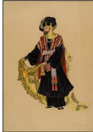
Նկ. 1. Ալեքսեյ Դանդուրյան. Զգեստի էսքիզներ «Անահիտ» ֆիլմի համար, 1947 թ., թուղթ, գուաշ, տուշ, բրոնզ (ՀԱՊ)