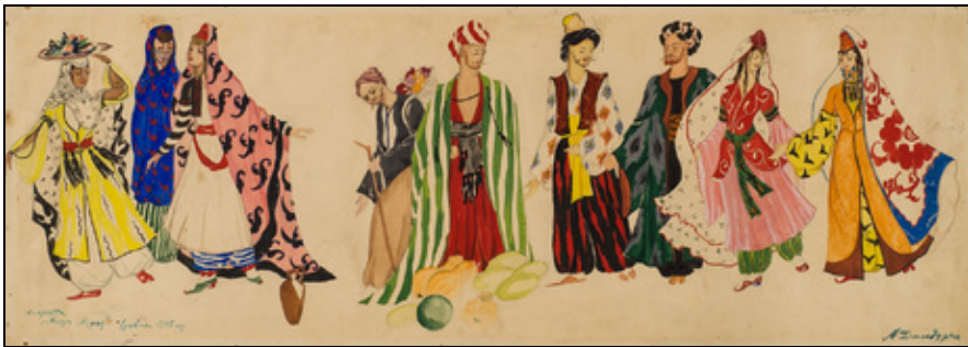
Նկ. 2. Ալեքսեյ Դանդուրյան. Զգեստի էսքիզներ Արտեմի Այվազյանի «Աշուղ Մուրադ» օպերետի համար, 1945 թ., թուղթ, ջրաներկ, գուաշ (ՀԱՊ)