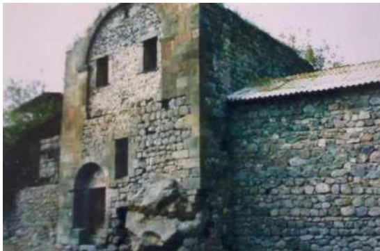
Մելիք-Հայկազ Բ-ի՝ Խանածախում կառուցած ապարանքը (16-րդ դ.)

Քաղաքացիական վաղ կառույցներից մեզ են հասել նաև մելիքական ապարանքները Խանածախ, Տեղ և Խնձորեսկ գյուղերում: Ապարանքների կառուցումը իրականացնողները, անշուշտ, եղել են բարձրակարգ շինարար-վարպետներ, որոնք ցուցաբերել են ճարտարագիտական ու ճարտարապետական հմտություններ և կարողություններ: Մելիքական ապարանքը եղել է համալիր կառույց՝ պարասպի մեջ առնելով նաև օրինազանցների համար նախատեսված բանտը, բաղնիքը, հացատունը, զորանոցը և այլ կարգի շինություններ: Հաստ ու բարձր պարիսպների առկայությունը վկայում է, որ ապարանքը եղել է նաև պաշտպանված հանկարծակի հարձակումից: