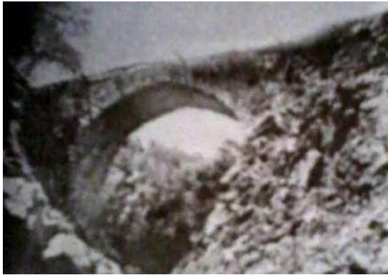
Հարժիսի ձոր: Սատանի կամուրջը

Հարժիսի ձորում պահպանվել է այդ ժամանակաշրջանում Որոտան գետի վրա կառուցված միաթոռիչք քարե կամուրջը: Կամրջի ներքին հատվածը կլոր է, որի պատճառով տեղաբնակներն այն կոչում են «Սատանի կամուրջ»: Նրա վրա կա օտար լեզվով արձանագրություն, որը չի հրապարակված: