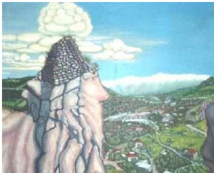
Թեքված ժայռի գլխին պահպանված բերդի պատի հատված: Գեղանկար Ն. Թադևոսյանի, 1992 թ.

Նմանատիպ կառույցների մեծ մասը լիովին կամ մասամբ կիսավեր կամ անօգտագործելի վիճակում են, սակայն դրանց չափերը իրականացման մասշտաբները, ծավալները որոշակի տպավորություն են թողնում՝ լինելով երբեմն ինժեներական բարդ խնդիրների լուծումների արգասիք: Աննշան չափով են պահպանվել հատկապես հին բերդերն ու ամրոցները: Թշնամին երկրամաս ներխուժելուց հետո դրանք քանդել-հողին է հավասարեցրել: Հզոր բերդ է եղել նաև Գորիս գյուղի գլխավերևում, որն այսօր տեղացիները կոչում են Բերդ-քերձ : Այդ կառույցից մնացել է ժայռի ծայրին կպած բերդապատի մի փոքրիկ հատված, որը երկրաշարժից ժայռի հետ պոկվել է հիմնական պատից ու թեքվել առաջ: Հիմնական պատը չկա, բայց ժայռի պտկին թառած պատի հատվածը մնացել է: