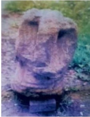
Վնասված դեմքով գլուխ: Հարժիս: Տեղական սպիտակ քար: Բարձրությունը՝ 50 սմ, լայնությունը՝ 25 սմ