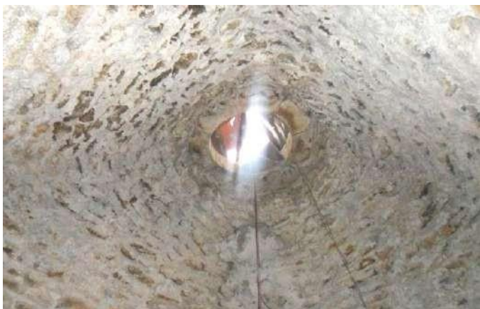
Մելիք Բարխուդարի ապարանքի սեղանատան գմբեթավոր առաստաղը ներսից: Տեղ գյուղ, 1783 թ.

Հին Խնձորեսկում գտնվող կիսավեր մելիքական ապարանքը պատկանել է Մելիք-Փարամազին: Մելիքական ապարանք-ամարաթները, պատկանելով ուշ միջնադարին, իրենց մեջ պարունակում են ավելի վաղ ժամանակների պալատական ճարտարապետության շատ տարրեր: