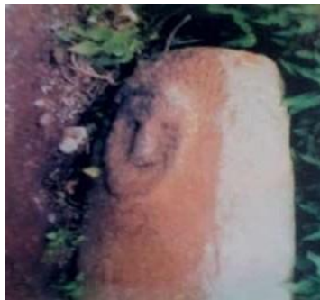
Պաշտամունքային սյան գլխամաս, խորհրդավոր ծայիտով դիմաքանդակով: Սյան երկարությունն է՝ 2 մ 60 սմ, կողերի լայնությունը՝ 36 սմ x 46 սմ: Հարժիս