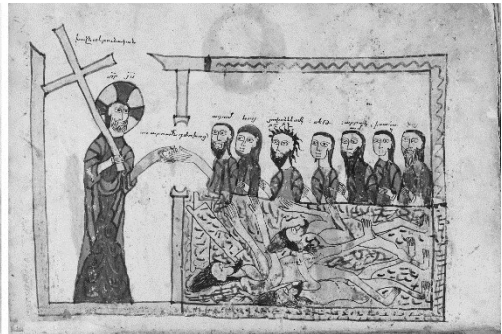
Նկ. 3. ՄՄ 4806, Բերդակ, 1306 ք., նկարիչ՝ Հովսիան

տագայում պարզ երևում են XIII-XIV դարերի Բերկրիի ձեռագրերում (Վասպուրական): Լայնակի տեղադրվածությամբ մանրանկարներ կարող ենք տեսնել Վասպուրականից նաև Սիմեոն Արճիշեցու ձեռագրերում (Արճեշ) և այլն: