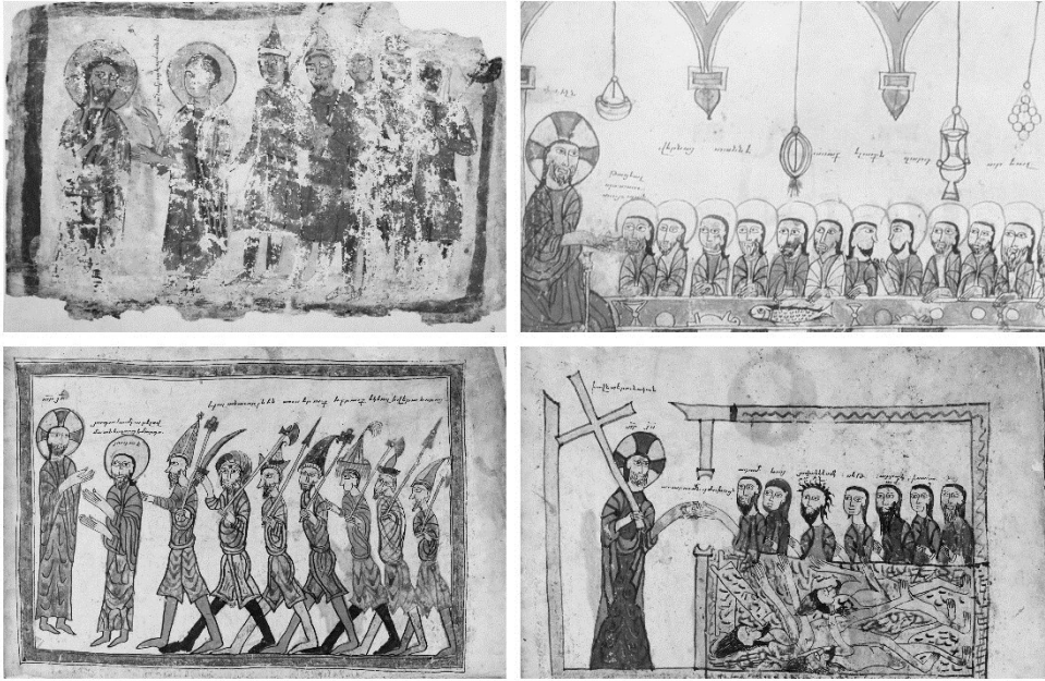
Նկ. 14. Ձեռագրեր՝ ՄՄ 4806, 1306 թ., Բերդակ, ծաղկող՝ Հովսիան, ՄՄ 11219 և 1038 թ., ՄՄ 6201 Ավետարան

վեհաշուք, աչ ձեռքը՝ օրհնութեան ժեստով: Հետաքրքիր է, որ Հիսուս թիկունքով է կանգնած դեպի կատարվող իրադարձությունը՝ դեմքով շրջված դեպի Հուդան և օրհնութեան ժեստ անելով: