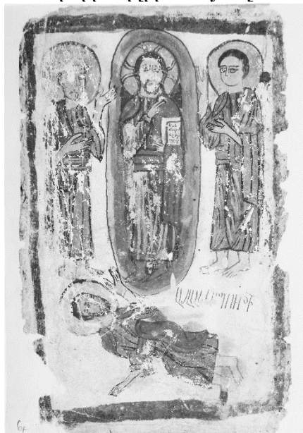
նկ. 15. ՄՄ 11219, Այլակերպություն, 6բ

Այլակերպություն (6բ): Հաջորդ մանրանկարը «Այլակերպություն» («Պայծառակերպություն») տեսարանն է (նկ. 15): էջի 2/3-ը՝ մանրանկարի վերին հատվածը, զբաղեցնում են երկարավուն փառապսակի մեջ