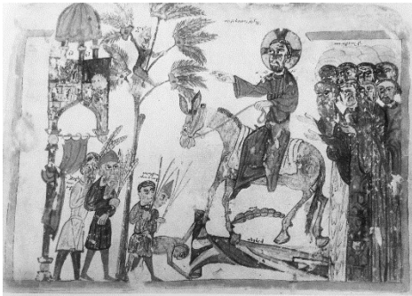
Նկ. 2. ՄՄ 4814, 1294 ք., Արգելան (Բերկրի), նկարիչ՝ հաչեռ

Բերկրիի ձեռագրերի խումբ: XI դարի գրքարվեստին բնորոշ մի շարք հատկանիշներ՝ մանրանկարների՝ թերթի երկու կողմերում և լայնակի տեղադրված լինելը, շրջանակների առկայությունը, ետնախորքի գրեթե բացակայությունը, պատկերագրական և ոճական մի շարք առանձնահատկություններ, հե-