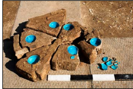
Նկ. 4. Գմբեթի մեծ ափսեի շուրջ յոթ երկնագույն թասերը