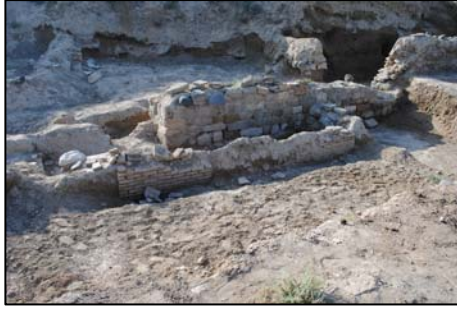
Նկ. 1. Հուշարձանի տարածքը չբացված վիճակում