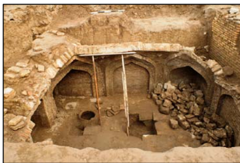
Նկ. 7. Կառույցի բացված խորշերը և սալահատակը