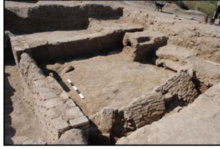
Նկ. 2. Կառույցի պեղման ընթացքը