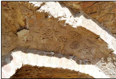
Նկ. 3. Աղյուսաշար խորշերի միջև քանդված մուտքը