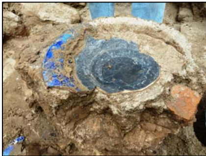
Նկ. 5. Գմբեթի առաստաղին ազդեցված կորպուսե մեծ ափսես