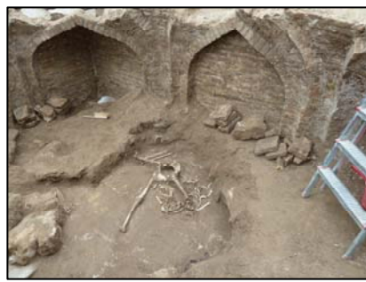
Նկ. 8. Շինության հարավարևմտյան հատվածը