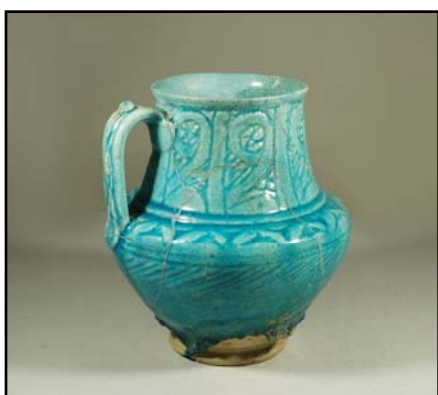
Նկ. 9. Հախճապակե փիրուզագույն սափոր՝ փորագիր հարդարանքով