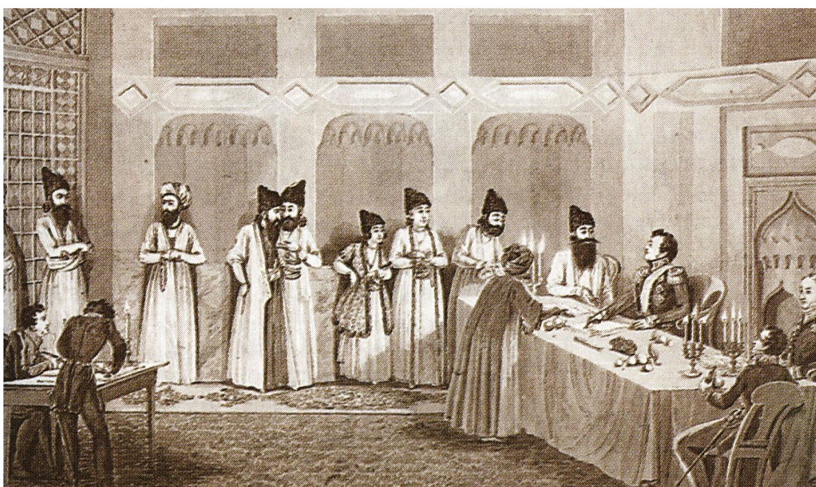
Рис. 2. Подписание мирного договора в Гюлистане

12 (24) октября 1813 г., стороны окончательно согласовали текст, и мирный договор в Гюлистане был подписан.