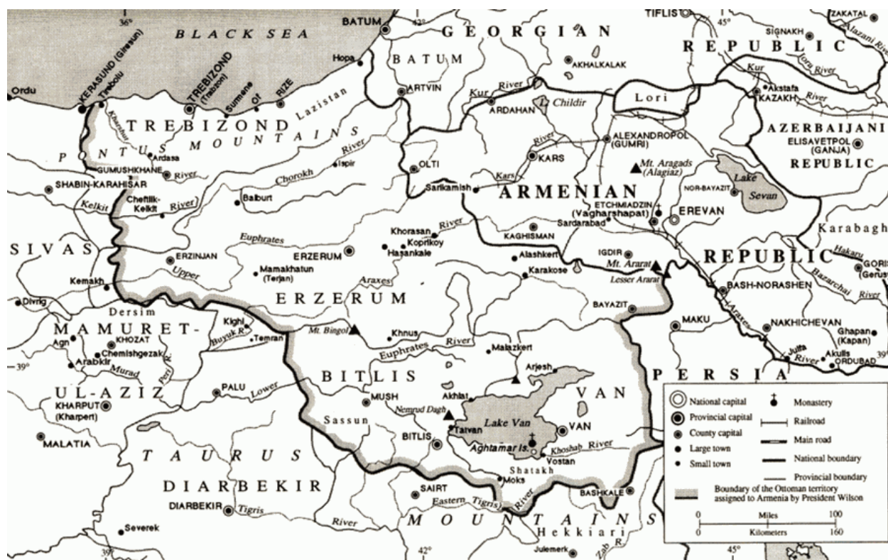
Рис. 3. По Гюлистанскому договору Карабах входил в состав Восточной (Российской) Армении (не Ширвана)

Российской империи. Геополитические возможности России значительно увеличились. Территории, закрепленные по Гюлистану, стали фактически своеобразным и необходимым плацдармом для дальнейшего расширения ареала российского влияния. Как уже было отмечено, при его заключении свою роль сыграли многие иные факторы. Это и учет общей военно-политической обстановки, и продолжавшаяся война с Наполеоном в Европе, и позиция Турции, и осознание того, что с британской дипломатией предстоит еще большая борьба и то, что вооруженные силы Персии еще не окончательно разгромлены, и что после Отечественной войны 1812 г. и продолжения заграничного похода наблюдается истощение российских как материальных, так и людских ресурсов.