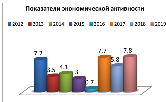
Рисунок 3. Показатели экономической активности Армении в 2012-2019 гг.

Все это, по нашему убеждению, является результатом не только положительных внутри-экономических тенденций, но и внешних факторов, среди которых особо следует отметить членство и председательство Армении в ЕАЭС.