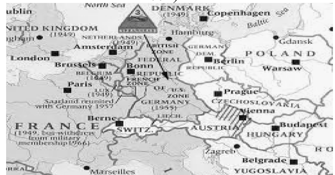
Рисунок 2. Карта послевоенной Европы (1945-1992)