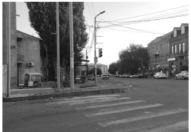
Նկ. 2. Աշտարակ. Ուռուց

Հրապարակից վերև բարձրացող հատվածը կոչվում է Ուռուց (նկ. 2), որը այդպես է կոչվել այն ժամանակներից, երբ գյուղացիները դեռ նոր էին ընդլայնում իրենց բնակավայրը, որը սկսվում է Բերդաթաղից: Այն Աշտարակի կորիզի հուժարձաններն իրար կապող գլխավոր խաչմերուկն է: Տեղացիների