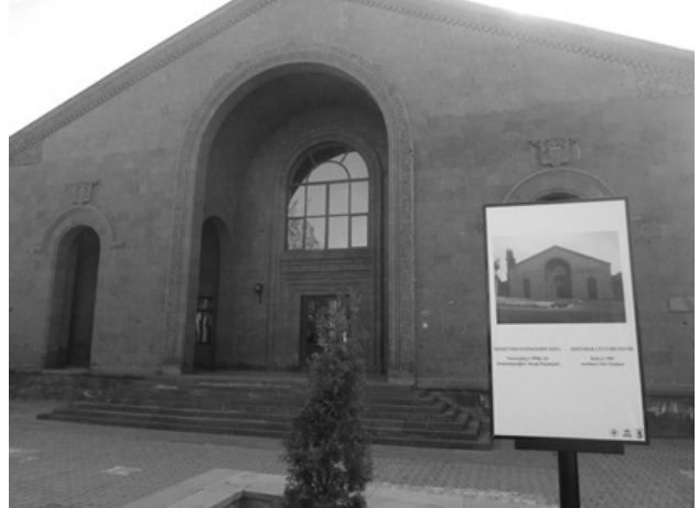
Նկ. 1. Աշտարակի մշակույթի տունը

Հրապարակում է գտնվում Աշտարակի քաղաքապետարանը և քաղաքային մշակույթի տունը (նկ. 1): Վերջինս կառուցվել է 1950 թվականին, ճարտարապետ Յուրի Յարալովի կողմից: Երկհարկանի այս կառույցն ունի բոլոր պայմանները քաղաքում մշակութային կյանքը զարգացնելու համար: Օրինակ, գլխավոր սրահում կազմակերպված են լուսային և ձայնային միջոցառումներ, հանդիսատեսների հատվածը աստիճանաձև վեր բարձրացող շարքեր են: Մշակույթի տունը գտնվում է բարվոք վիճակում և գործող է, սակայն այստեղ հազվադեպ են կազմակերպվում միջոցառումներ, ինչպես նաև բավական երկար ժամանակահատված վերանորոգման չի ենթարկվել և ունի թարմացման կարիք: