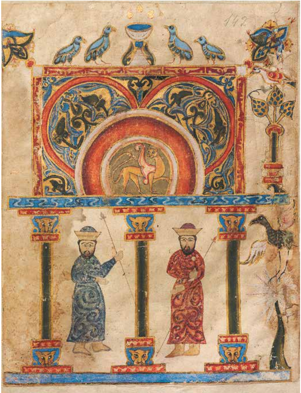
XIX. Մյունիքի Բուրթել (աջից) և Բուղրա Օրբելյան իշխանները, Ավերարան, 1306 թ., Եղեգիս (Մատենադարան, ձեռ. 10525, էջ 142ա):