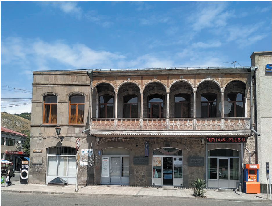
XVI. Նժդեհի պարզամեր Գորիսում