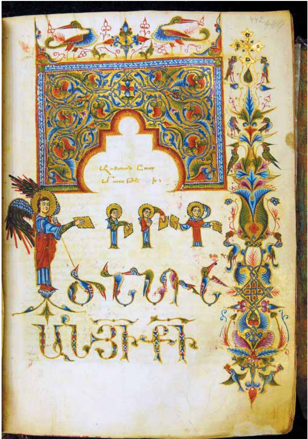
XX. ՄՄ ձև. 206, Ալֆարարան, 1318 թ., Գլաձոր, ծաղկող թորոս Տարոնեցի: