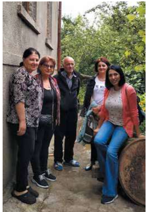
XII., XIII., XIV. Գիրարշավ, Սյունիք, 2019