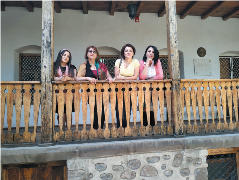
XV. Գիրարչավ, Սյունիք, 2019, Ակսել Բակունցի հարկի տակ