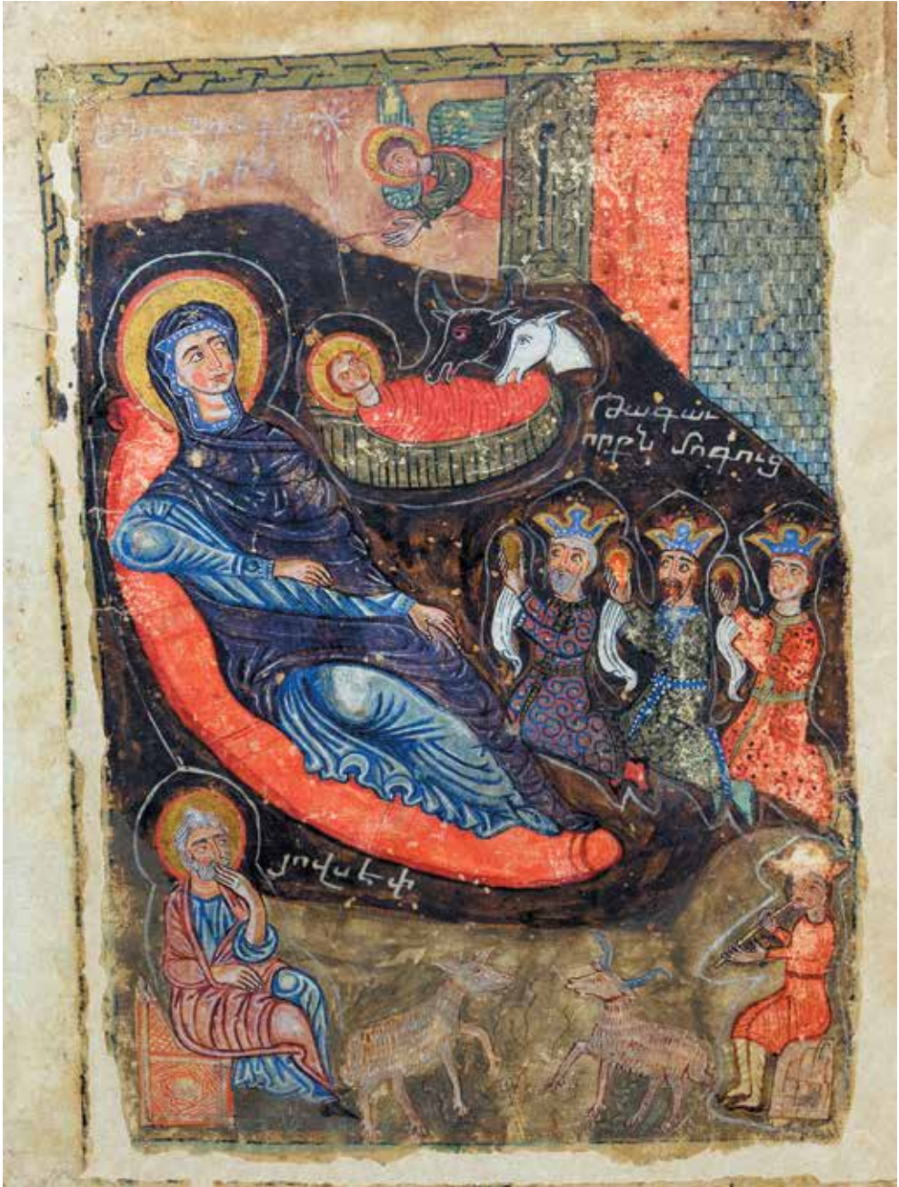
XVII. Ս. Ծնունդ, Ավետարան, 1378 թ. Տաթևում նկարագրողի է Գրիգոր Տաթևացի (Մատենադարան, ձեռ. 7482, էջ 249ր):