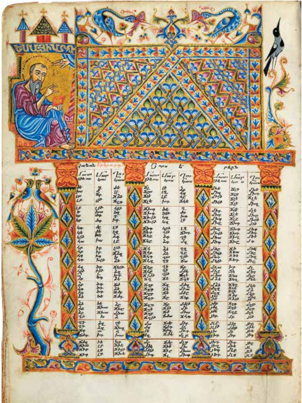
XVIII. Խորան, լուսանցքում Գլաճորի համալսարանի բարոնասկեր Եսայի Նչեցու դիմանկարը, Ասրվաձաշունչ, 1318 թ., Գլաճոր, նկարիչ Թորոս Տարոնացի (Մարենադարան, ձեռ. 206, էջ 437բ):