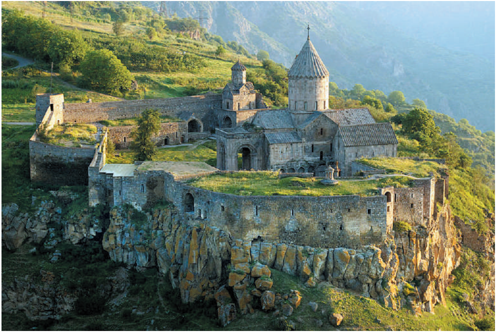
XXVI. Տարթի վանք