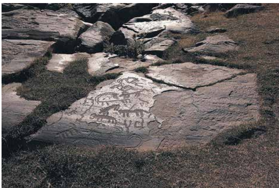
XXV. Ուդրասարի ժայռապարկերները