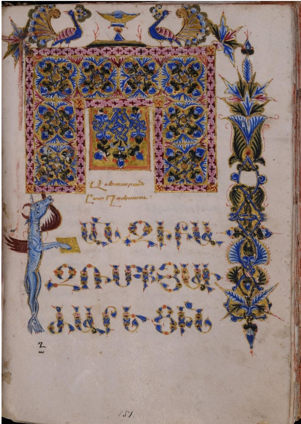
1307թ. Եսայի Նչեցու Ավետարան, Ղուկասի Ավետարանի տիտղոսաթերթ, էջ 151ա