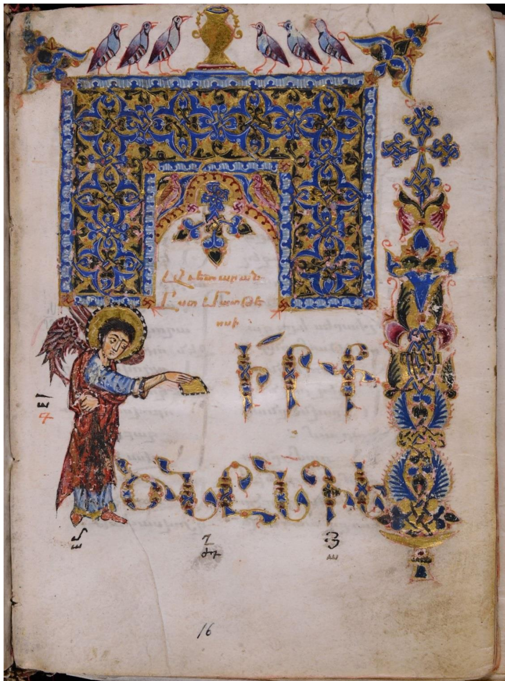
1307թ. Եսայի Նչեցու ավետարան, Մատթեոսի ավետարանի տիտղոսաթերթ, էջ 16ա