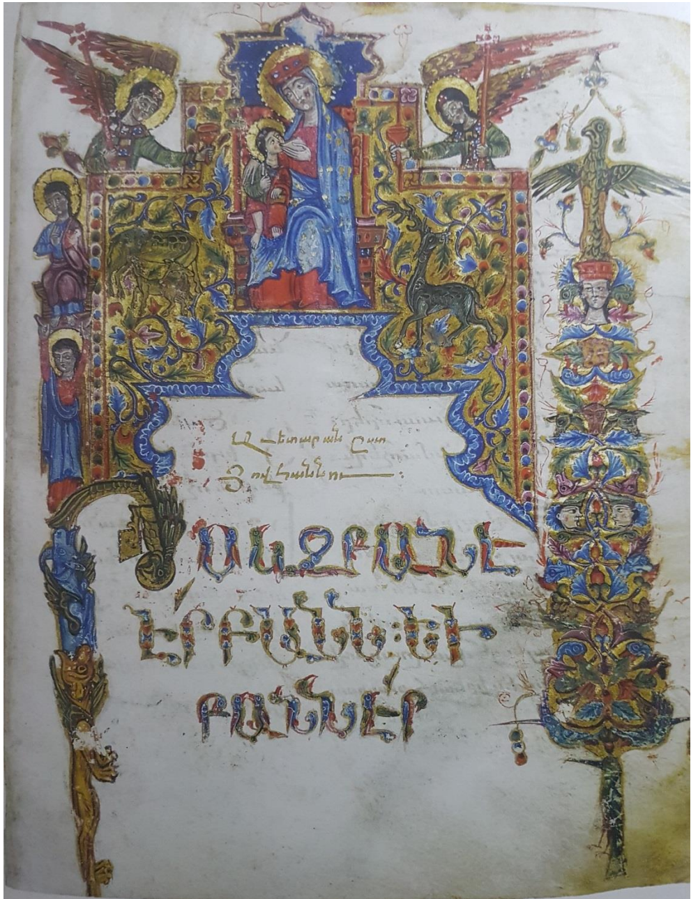
1323թ. ավետարան, Հովհաննեսի Ավետարանի տիտղոսաթերթ, էջ 226ա