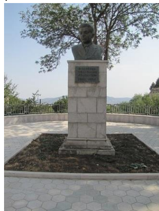
Памятник Тевосяна в городе Шуши Республики Арцах

Ованес Тевосян родился в 1902 году, в городе Шуши, в бедной армянской семье. Семья Тевосянов, спасаясь от шушинской резни («Թևոսյան Յովհաննես Թևադրոսի») на этнической и религиозной почве, носившей периодический характер (Потто 1-5), была вынуждена переехать из Шуши в Баку, где Ованес получил начальное образование в православной школе. Он учился блестяще и по окончании школы уже сам, как репетитор, занимался с учениками. Параллельно он сам заочно учился в гимназии.