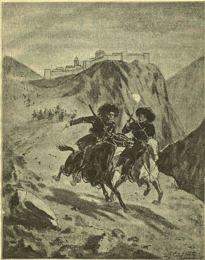
Цѣлыя сотни персидскихъ всадниковъ неслись за двумя казаками, взявшимися доставить въ Тифлисъ важныя донесенія.