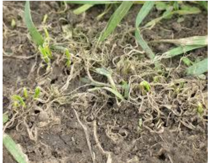
Նկ. 2 Հացագնայուկի թրթուրը և նրա կողմից վնասված աշնանացան ցորենի բույսը