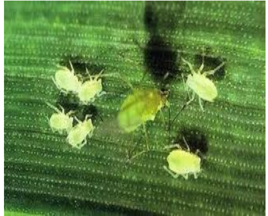
Նկ. 3 Հացահատիկի սովորական լվիճը գաղութներով