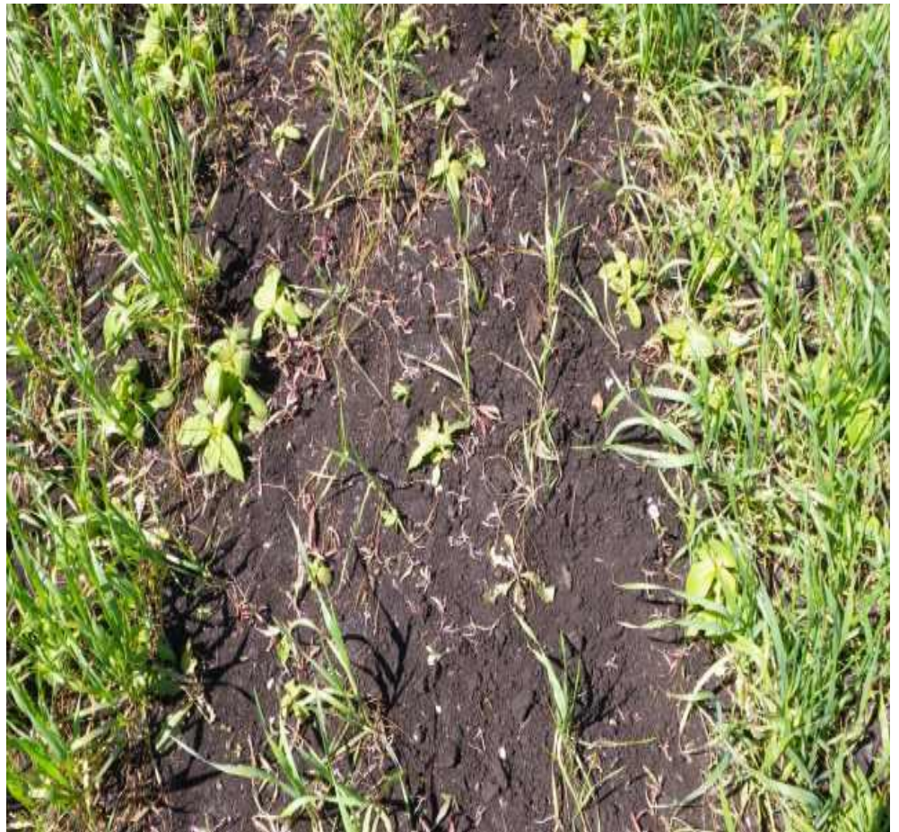
Նկ. 10 Շվեդիական ճանճի կողմից հասցրած վնասը աշնանացանի ցանքսում