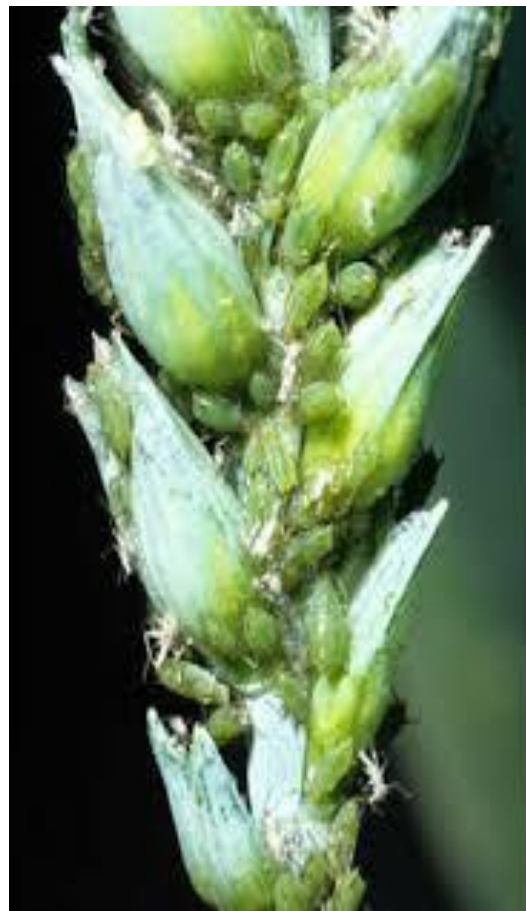
Նկ. 4 Հացաբույսերի մեծ լվիճի գաղութը ցորենի հասկի վրա