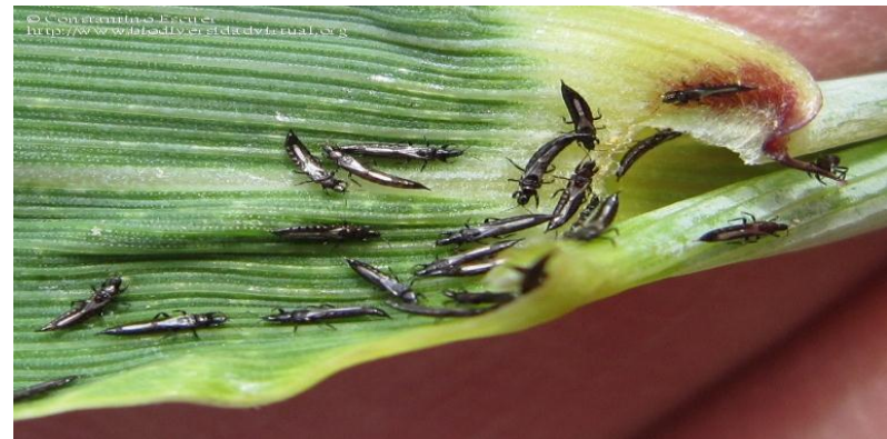
Նկ. 6 Թրիպսի տարբեր փուլերը ցորենի տերևի և հասկի վրա