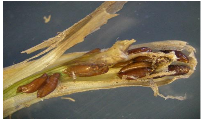
Նկ. 7 Հետեւյաւն ճաւնճի հասոււնը, թրթուրը և հարսնյակը