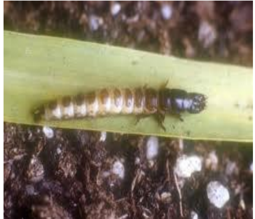
Նկ 1. Սովորական հացագնայուկի հասուն բզեզը և թրթուրը