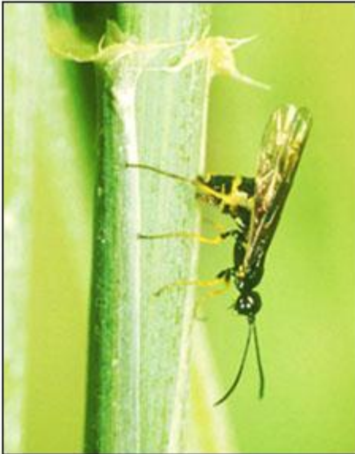
Wheat stem sawfly ovipositing.