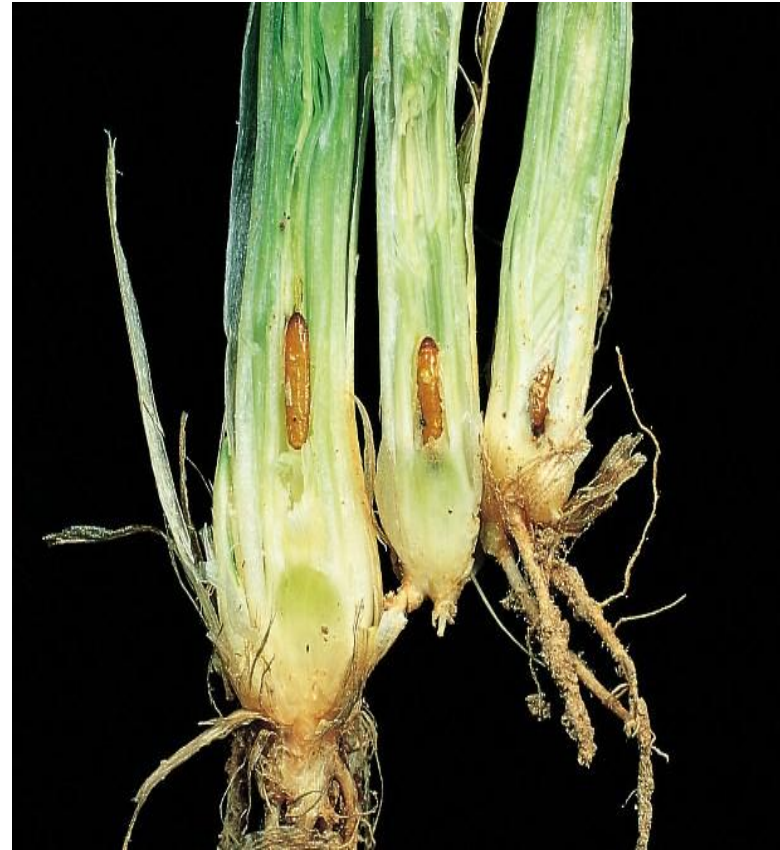
Նկ. 9 Շվեդիական ճանճի հասունը, թրթուրը և հարսնյակը