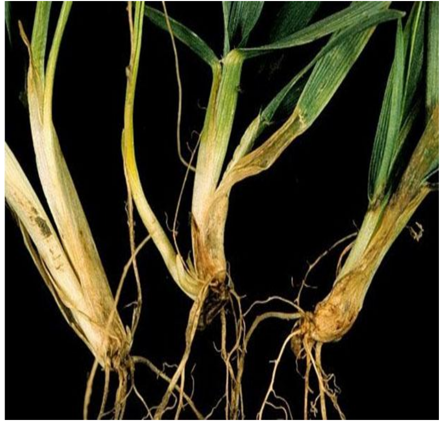
Նկ. 8 Հեսեռնյան ճանճի կողմից վնասված հացաբույսերը