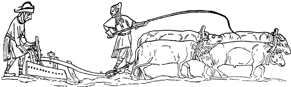
Пахота на волах.