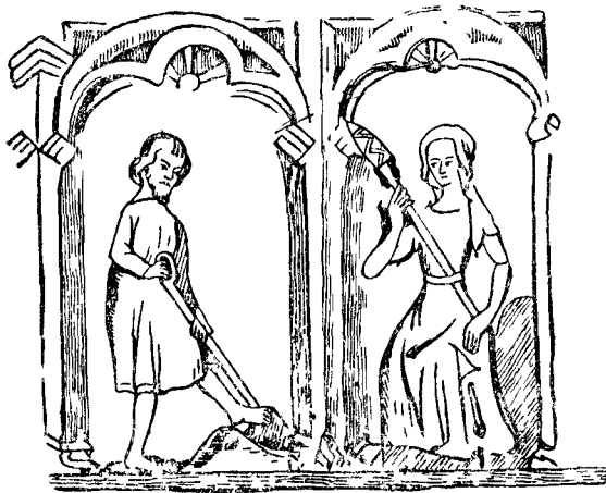
«Когда Адам копал, а Ева прядла, кто был дворянином?» С англ. миниатюры XIV в.

На следующий день (14 июня) повстанцы категорически потребовали от короля выдачи Симона Сэдбери, Роберта Хейлза и других, угрожая в противном случае силой захватить Тауэр и истребить всех, кто в нем укрылся. Угроза подействовала: Ричард согласился на новое свидание с повстанцами;