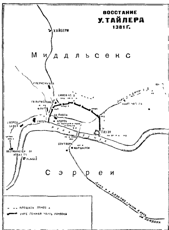
Карта восстания. Лондон. 13—15 июня 1381 г.