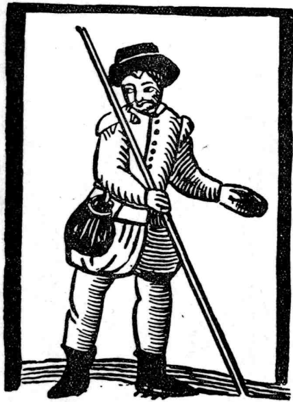
Английский крестьянин XVII века.