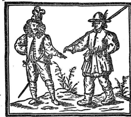
Титул английской деревни XVII века: сквайр и крестьянин (со старинной гравюры из коллекции ИМЭЛ).

ли обрекали крестьян на голодное существование и заставляли покидать свое хозяйство. Тщетно протестовали крестьяне, напрасно подавали они петиции правительству, у которого искали защиты, государственные учреждения неизменно поддерживали их притеснителей. Но жители топей были не таким народом, чтобы сдаться без борьбы. Недовольство их росло: в тавернах, а затем и на улицах распевались песенки, в которых язвительно высмеивали осушителей. Особенно доставляло голландским инженерам, ибо они не только руководили всеми мелиоративными предприятиями, но и сбивали цену на рабочую силу, выпысывая иностранных рабочих. Фенмены называли ненавистных голландцев «ненасытными душами» («thirsty souls») и говорили, что если они переселятся на луну, то и там скоро исчезнет вода: они осушат все 5 . Но предприниматели не обращали внимания на все протесты и делали свое дело. Тогда-то фенмены перешли от слов к активным действиям: они препятствовали работам, разрушали плотины и насыпи, устраивали наводнения. В 1637 г. волнения крестьян приняли очень ожесточенный характер. Правительство вызвало войска, предадо суду повстанцев и заключило их в тюрьму. Участники одного из таких выступлений в Эпуорсе (Линконшир) сами рассказывают в своей более поздней петиции парламенту, что, по