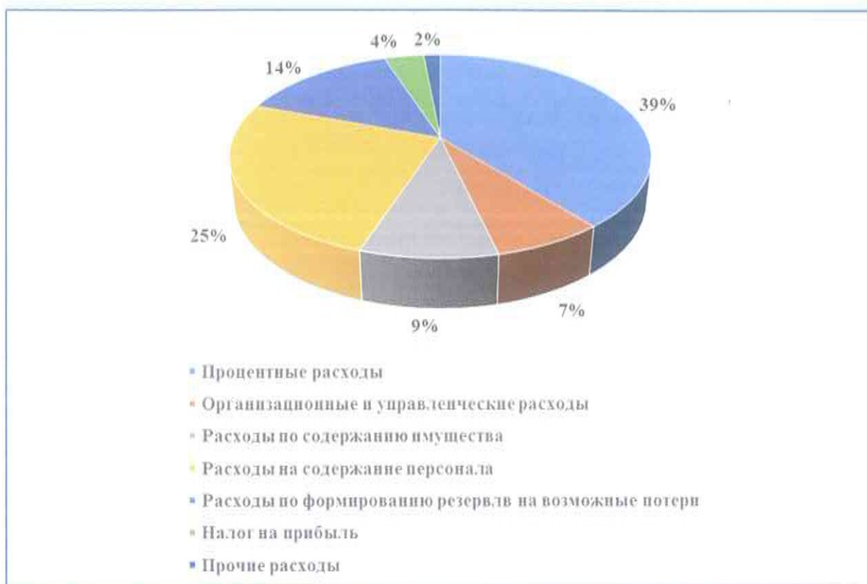
Рисунок 2. Структура расходов ООО КБ "ГТ банк" за 2012 год.

- расходы по формированию резервов на возможные потери 14% (в 2011 году - 9%) (рис.2).