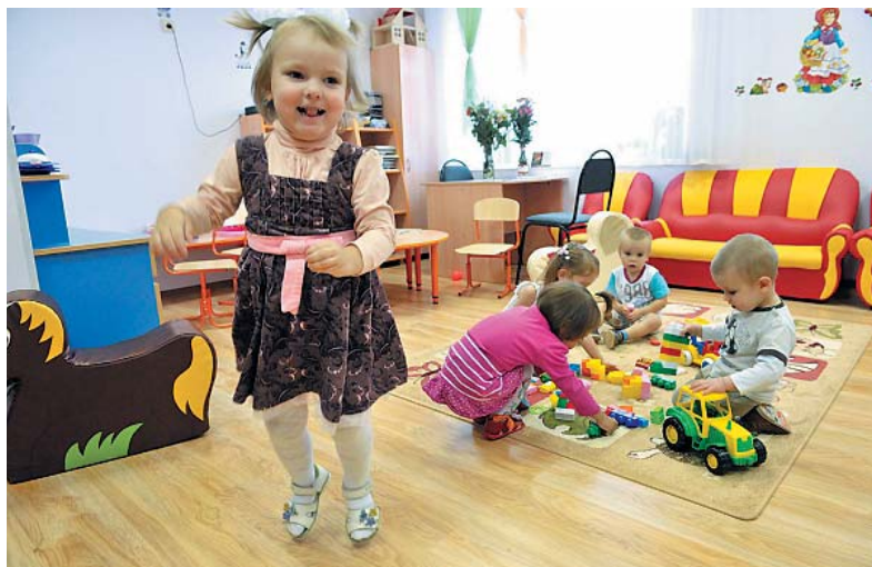
Билдинг-сады помогут сократить очереди в детсады по всей стране.

Она знает, как ликвидировать очереди в детсады