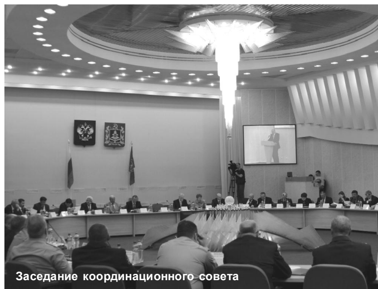
Заседание координационного совета

В повестке дня работы заседания значились два основных вопроса. Сначала собравшиеся обсудили проблемные вопросы, связанные с координацией деятельности уголовно-исполнительных инспекций с органами занятости и внутренних дел, судебными приставами и ины-