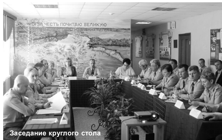
Заседание круглого стола

Кстати, уже сегодня работа психологов Брянской воспитательной колонии сделала поворот от шаблонных