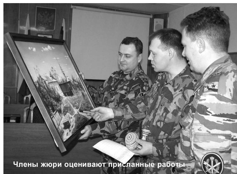
Члены жюри оценивают присланные работы