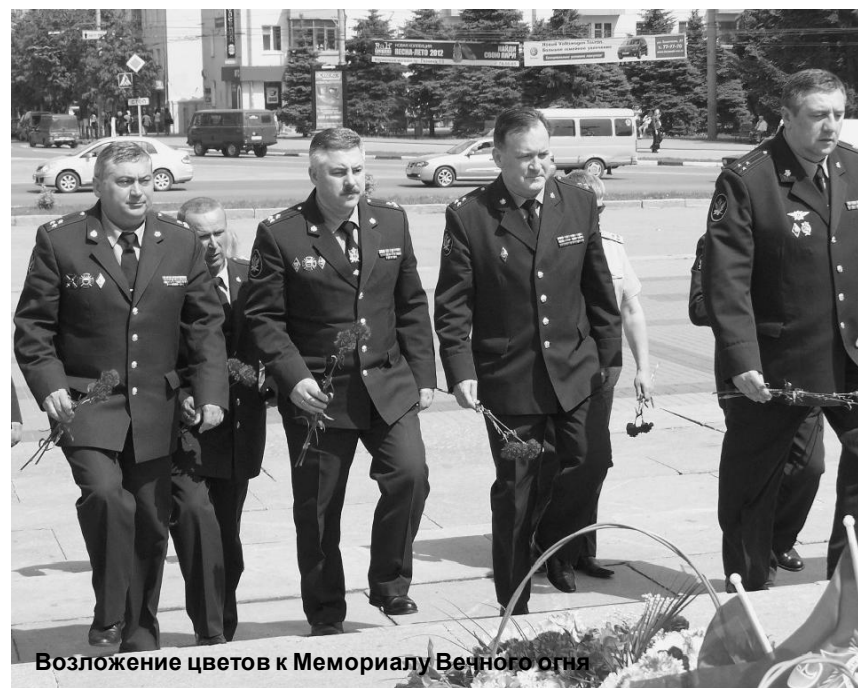
Возложение цветов к Мемориалу Вечного огня