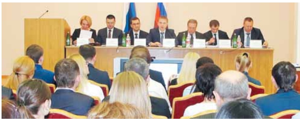
Обсуждение итогов работы управления за 2015 год

Примерно в 1,5 раза увеличилось количество запросов о выдаче информации из ЕГРП по сравнению с 2014 годом, и составило более полумиллиона запросов. При этом в электронном виде поступило свыше 350 тысяч запросов, в том числе посредством системы межведомственного электронного взаимодействия поступило свыше 290 тысяч, и более 58 тысяч через портал Росреестра. Стоит отметить, что для удобства заявителей появилась возможность с середины прошлого года подать документы для регистрации прав не только посетив офисы Управления Росреестра по Ставропольскому краю, Кадастровой палаты и МФЦ, но и воспользовавшись сервисом Росреестра «Государственная регистрация прав на недвижимое имущество» на портале