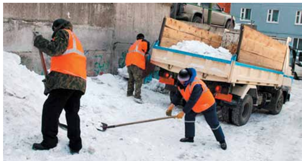
Полосу подготовила Юлия Ивакина

По представлению судебных приставов Пятигорского ГО, за несвоевременную оплату задолженности, суд заменил гражданину уголовный штраф в 100 000 рублей на 240 часов обязательных работ.