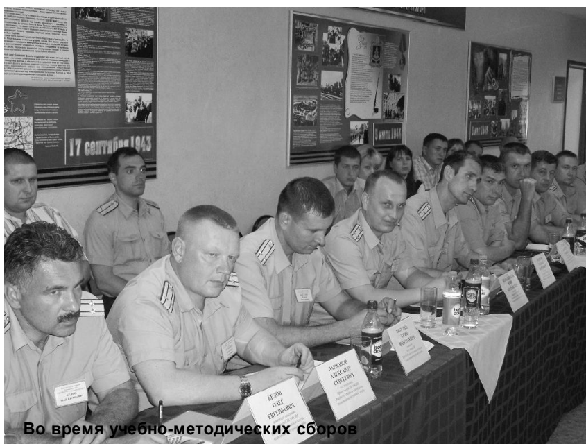
Во время учебно-методических сборов