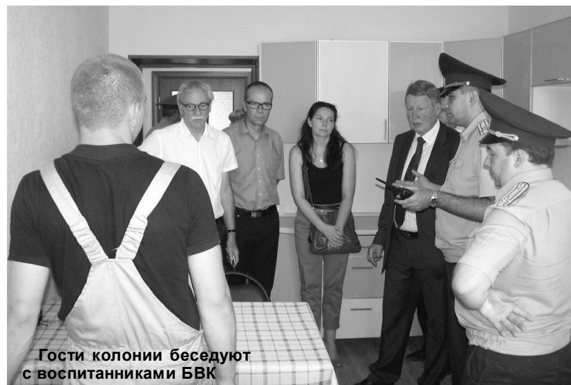
Гости колонии беседуют с воспитанниками БВК

После осмотра учреждения состоялась беседа гостей с сотрудниками воспитательной, психологической и социальной служб БВК. Ханс Ульрих Майер сказал о том, что увиденное в Брянской воспитательной колонии произвело на него самое благоприятное впечатление, - «Несмотря на то, что создание воспитательного центра в БВК еще