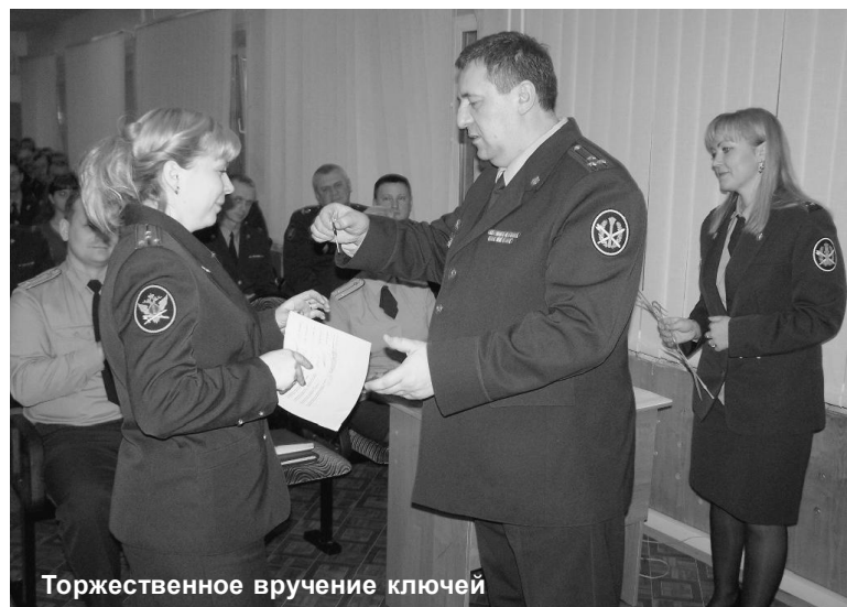
Торжественное вручение ключей

При возведении здания был использован ряд новых современных строительных технологий, и спустя полтора года строительство было успешно завершено. Взору горожан предстал 24 квартирный, двухсекционный 3-х этажный жилой дом со всеми необходимыми коммуникациями. По словам руководства Суражского района Брянской области, дом, построенный УФСИН, стал украшением всего архитектурного ансамбля города.