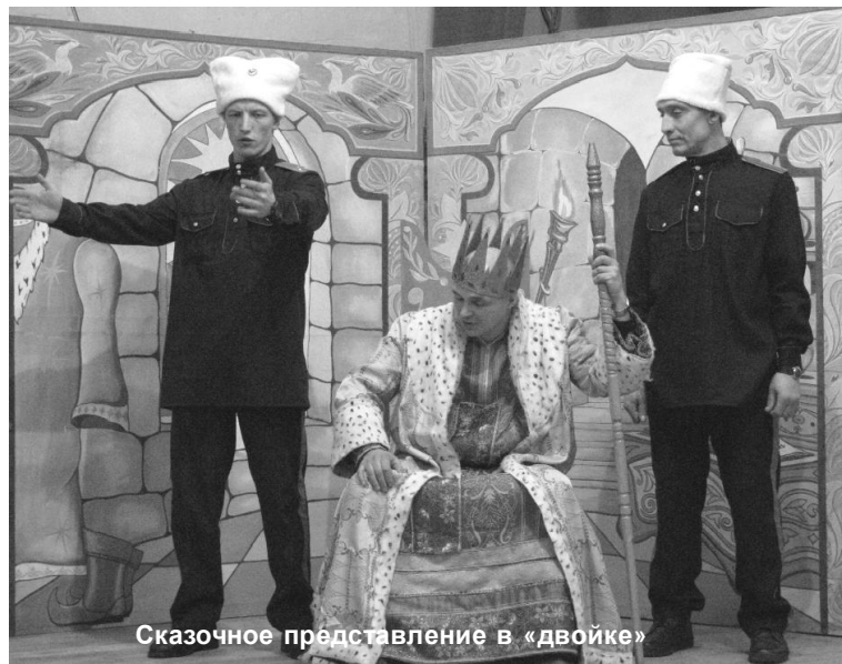
Сказочное представление в «двойке»

Добрых слов заслуживает и конкурсное представление в Клиновской колонии общего режима. Представление в учреждении было поделено на три действия, а вело его сразу двое конферансье. Действо на сцене клу-