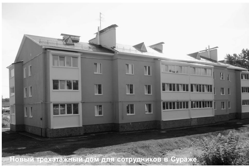
Новый трехэтажный дом для сотрудников в Сураже