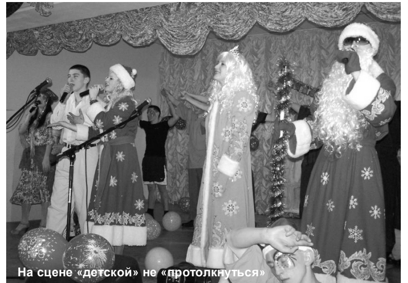
На сцене «детской» не «протолкнуться»

По традиции яркой и насыщенной выдалась концертная программа новогоднего представления в Брянской воспитательной колонии. Стихи, песни, зажигательные танцы и веселые хороводы, всевозможные конкурсы и подарки - все это было в красочном сценическом действе, происходившем на сцене БВК. Ну и, конечно, какой Новый Год без привычных и любимых всеми сказочных персонажей - Деда Мороза, его спутницы Снегурочки, Снеговика и других. Среди них были и те, которые, всячески пытались помешать новогоднему карнавалу. Однако, ни Змею-Горынычу, ни Бабе-Яге так и не удалось сорвать праздничное действо. Силы добра и всепобеждающая любовь оказались сильнее коварных замыслов недоброжелателей.