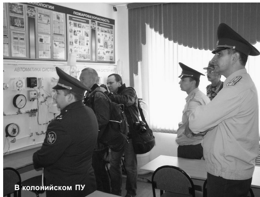
В колониjsком ПУ

Далее журналистам предложили совершить познавательную экскурсию непосредственно по жилой зоне колонии. С момента начала строительных и