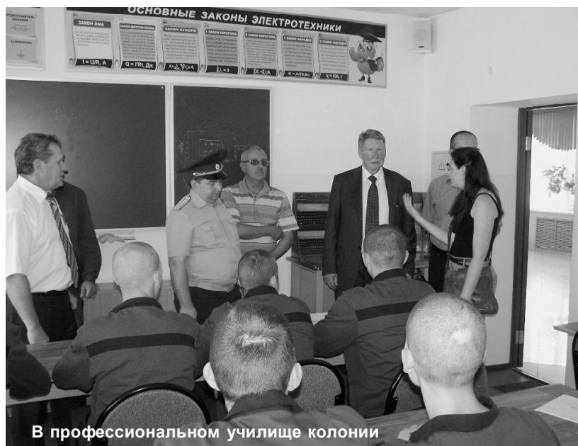
В профессиональном училище колонии