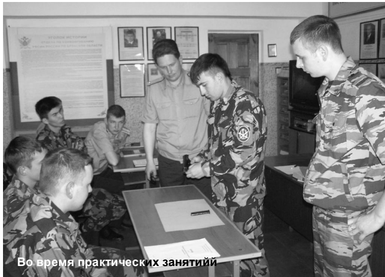
Во время практических занятий

Также вчерашним выпускникам ВУЗов ФСИН России, а ныне, уже действующим сотрудникам уголовно-исполнительной системы Брянщины, предстояло продемонстрировать уровень своей физической подготовки. Молодые офицеры соревновались в челночном беге, выполняли комплексно-силовое упражнение и бежали километровой кросс. Практические навыки применения приемов борьбы сотрудники продемон-