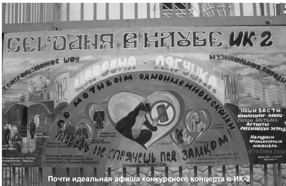
Почти идеальная афиша конкурсного концерта в ИК-2

Очередной ежегодный смотр-конкурс художественной самодеятельности завершился в учреждениях УИС Брянской области. И нужно сказать, что осужденные брянских колоний с удовольствием играли на сцене, чего не наблюдалось в предыдущие годы. Коллективы, выступавших на сцене, были достаточно многочисленными, а колонийские залы заполнены, и что немаловажно, зрители активно аплодировали своим коллегам по несчастью.