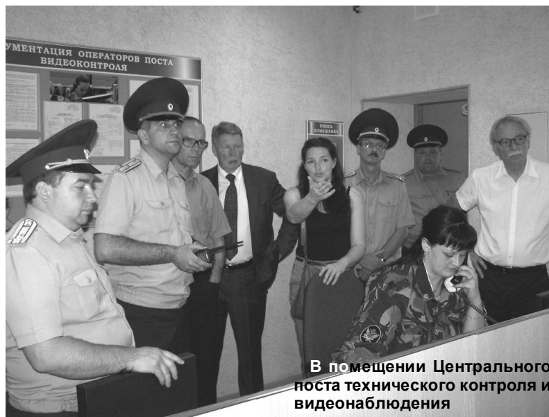
В помещении Центрального поста технического контроля и видеонаблюдения