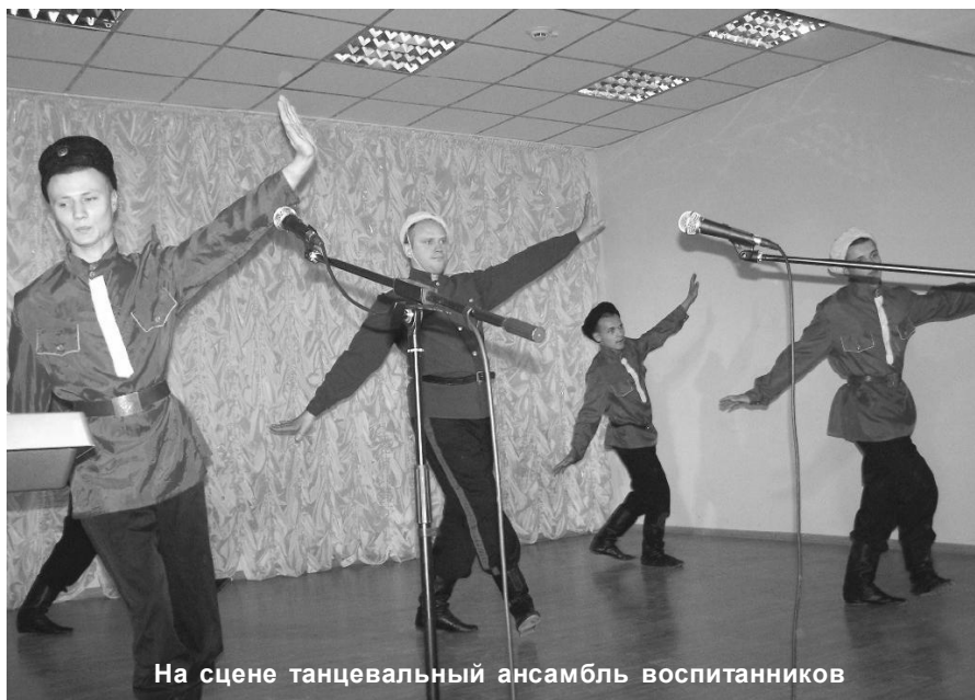
На сцене танцевальный ансамбль воспитанников