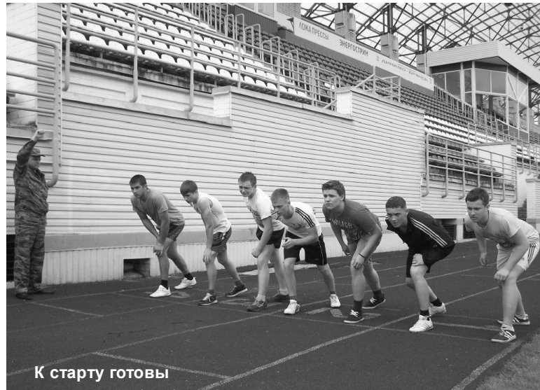
К старту готовы

Нужно отметить, что с каждым годом количество выпускников, пожелавших связать свою дальнейшую карьеру со службой в уголовно-исполнительной системе, увеличивается. Также необходимо сказать и о том, что уже второй год подряд вступительные экзамены в профильные ВУЗы ФСИН будут сдавать воспитанники Брянского кадетского корпуса милиции имени капитана милиции В.И. Шкурного. Это стало возможным благодаря договору о сотрудничестве, заключенному в 2010 году между УФСИН России по Брянской области и Брянским кадетским корпусом милиции имени капитана милиции В.И. Шкурного. Одним из пунктов заключенного соглашения оговаривается возможность участия воспитанников кадетского корпуса на вступительных экзаменах в ВУЗах ФСИН России, а после окончания учебы и продолжения службы в учреждениях УИС Брянщины. В прошлом году восемь выпускников Брянского кадетского корпуса милиции имени капитана милиции В.И. Шкурного стали курсантами высших учебных заведений ФСИН России. В этом году свои знания на вступительных экзаменах также проверят трое кадетов из Дятьковской кадетской школы-интерната и по одному воспитаннику из Стародубского казачьего кадетского корпуса и кадетской школы-интерната «Юный спасатель» города Клинцы.