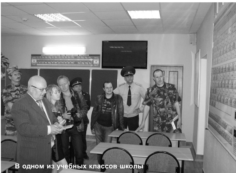
В одном из учебных классов школы