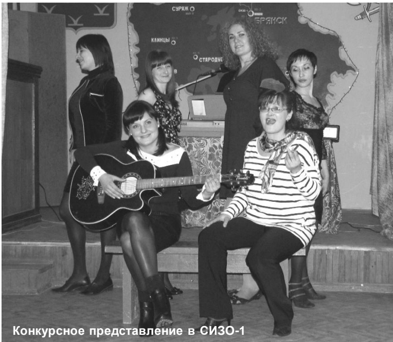
Конкурсное представление в СИЗО-1

Первыми зрителями стали коллеги артистов - осужденные отряда хозобслуги и сотрудники администрации.