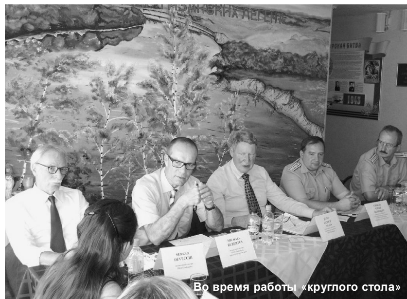
Во время работы «круглого стола»