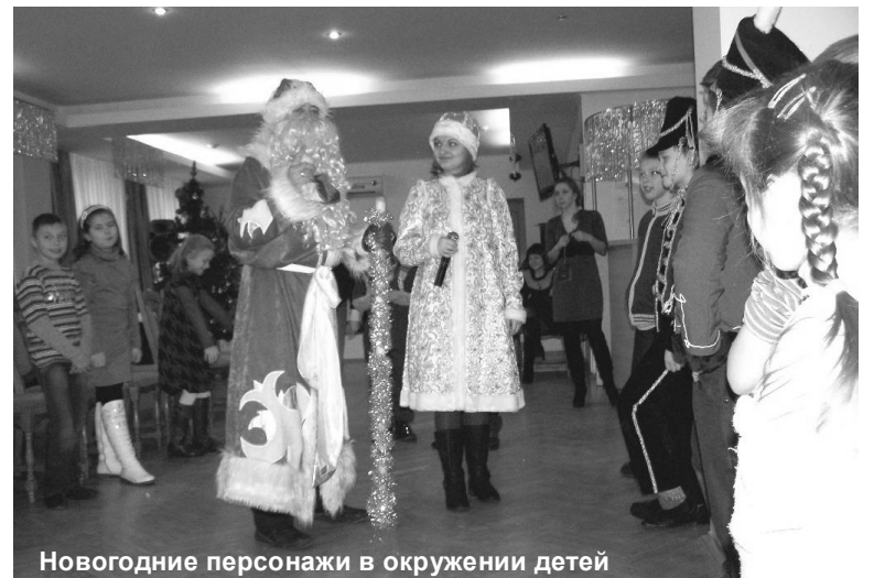
Новогодние персонажи в окружении детей