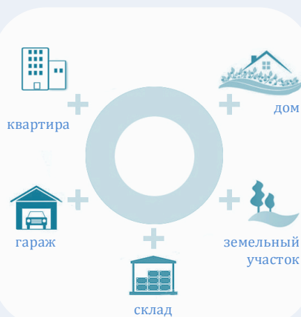
Схема 2. Недвижимое имущество

в) дачный земельный участок - земельный участок, предоставленный гражданину или приобретенный им в целях отдыха (с правом возведения жилого строения без права регистрации проживания в нем или жилого дома с правом регистрации проживания в нем и хозяйственных строений и сооружений, а также с правом выращивания плодовых, ягодных, овощных, бахчевых или иных сельскохозяйственных культур и картофеля).